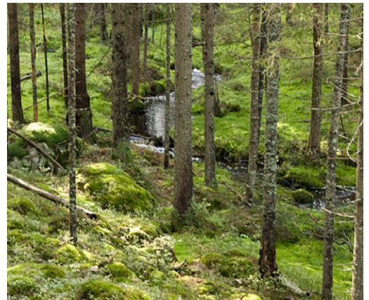
Ulvdrågen. Vitmosselav i mitten.

Den stora barrskogen söder om Store Flosjön har höga naturvärden. Här finns ett betydande antal ovanliga och krävande arter. Området är viktigt för att bevara den biologiska mångfalden