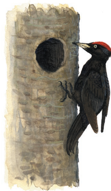
Spillkråka. Illustration: Michael Holmberg

Skitåsen är ett gammalt ”masteskogsområde”. Med anledning av virkesåtgången till flottan under 1600- och 1700-talen förbjöd kronan 1668 avverkning av furor som kunde vara lämpliga till fartygsmaster. På allmanningarna fanns ett antal utsedda områden med masteträd. Förbudet på allmanningarna gällde till 1932.