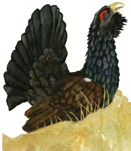
Tjäder. Illustration: Michael Holmberg