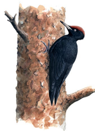
Från vänster: gröngöling, större hackspett och spillkråka. Illustrationer: Niklas Johansson

Grov asp, bukettformig björk och bastanta tallar präglar skogen i Pippelåsarnas naturreservat. Pippelåsarna är en så kallad lövbränna – ett gammalt brandfält där skogen fått utvecklas fritt sedan en skogsbrand drog genom området i början av 1920-talet.