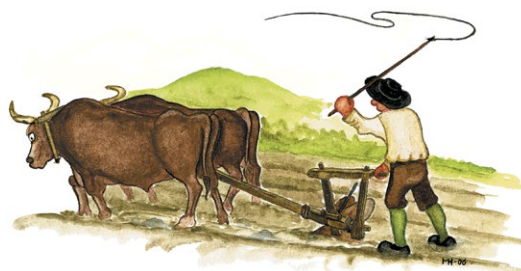
Vid det gamla torpet Sjötorp finns rester efter äldre åkermark

Myggedalens naturreservat ligger i ett landskap med höga naturvärden. Här finns gott om död ved, ett fuktigt lokalklimat och många små och specifika miljöer som gynnar ett stort antal hotade arter. Särskilt markant är den 30-40 meter djupa bäckdalen Myggedalen och det 216 meter höga Staplaberget.