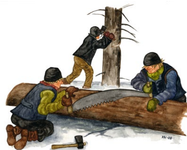
Spår efter äldre tiders skoghuggning finns här och var, men några skogsmaskiner har däremot aldrig påverkat Lobergshöjdens skog. Illustration: Margareta Hildebrandt

Det fuktiga klimatet beror bland annat på topografien, mängden av stora stenblock och myrmarker i skogen. I en mindre dalsänka hittar du den lilla myren Harflyet och i en markant dalgång nedanför slutningen ligger Märrensprängardråget. Bäckens som rinner genom dalgången avvattnar tjärnen Märrensprängaren.