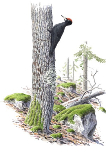
Spillkråka Illustration: Niklas Johansson

Berguven lockas av de branta stupen och häckar här regelbundet. Päruggla häckar gärna i spillkråkans gamla bohål, ofta uthackade i grova aspar. En sällsynt fågel som trivs här är den tretåiga hackspetten. Den kräver gammal skog med mycket död ved. Till vildmarkens arter hör också lodjuret, som observeras regelbundet i området.