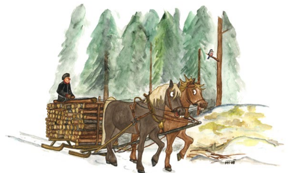
Skogsbruk skedde förr med häst i de otillgängliga skogarna. Illustration: Margareta Hildebrandt

Det lite kärva och bitvis otillgängliga landskapet är en av orsakerna till reservatets stora mångfald av arter. Mycket av skogen växer i branter och har varit svår att komma åt för det moderna skogsbrukets maskiner. Sedan hästen försvann ur skogsbruket i början av 1900-talet har skogen fått stå helt orörd. I de mer lättåtkomliga delarna av skogen finns fortfarande spår efter gamla körvägar, kolbottnar och mossbelupna stubbar.