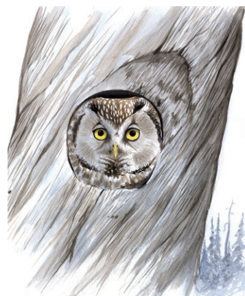
Päruggla Illustration: Jonas Lundin