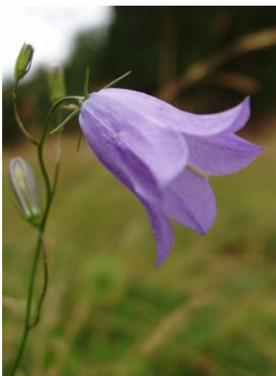
Liten blåklocka, slättergubbe och prästkrage.