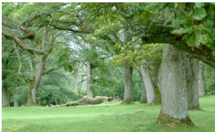
Pampiga ekar pryder ängen

Under medeltiden övertogs området av kungen och lades under kungsgården i Levene. Byn övergavs och marken blev slätteräng.