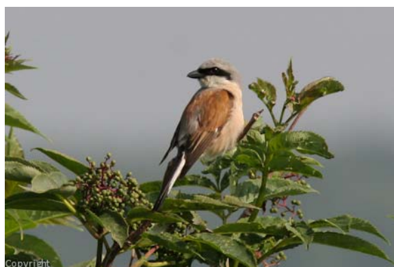
Två av bokskogens invånare, mindre hackspett och törnskata.