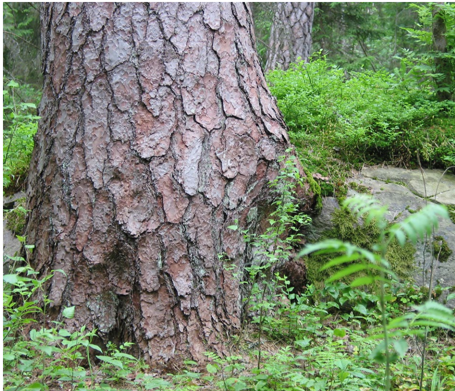
I reservatet växer många grova tallar med stammar på många diameter.

Kulanbeståndet skyddades av Länsstyrelsen redan 1934 för att bevara ett område med gammal grov tallskog. Området är naturskogsartat.