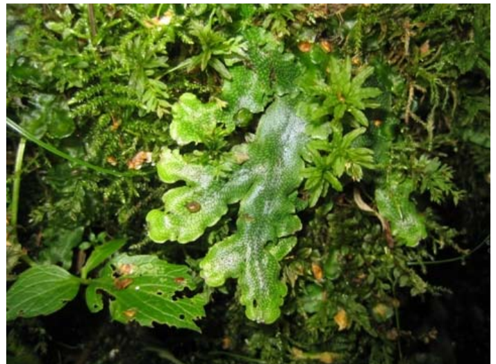
Rutlungmossa föredrar miljöer med rörligt kalkhaltigt markvatten.