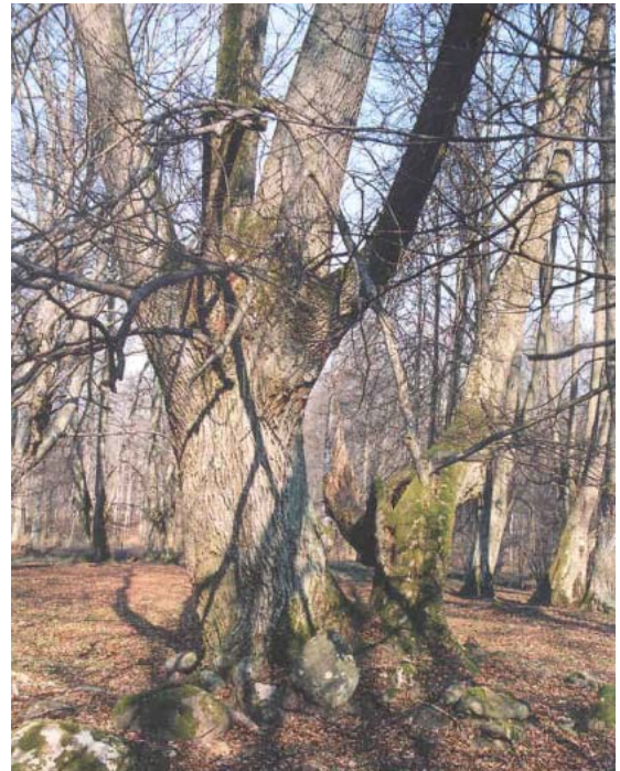
Tidigare hamlad lind.

I området finns många gamla grova ädellövträd, som har stor betydelse för traktens lövskogsfåglar. Här finns bl.a. mindre hackspett och göktyta. Träden har en värdefull moss- och lavflora. Ett annat av reservatets värden är de många blommande träd och buskar som erbjuder nektar och pollen åt olika insekter. Reservatet har ett stort värde som strövområde.