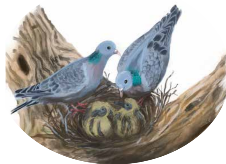
Skogsduva Columba oenas Stock dove

Du är välkommen uppleva skogen till fots men det finns i dagsläget inga markerade stigar.