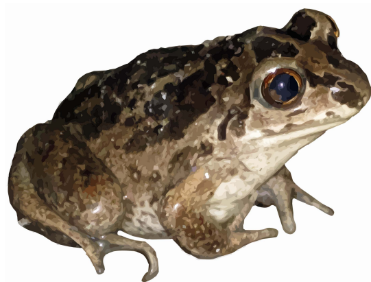
Lökgröda Pelobates fuscus

Stora våtmarksområden har torrlagts under de senaste århundradena. Av de kvarvarande småvattnen har många förstörts genom t ex övergödning, igenväxning eller inplantering av kräfter eller fisk.