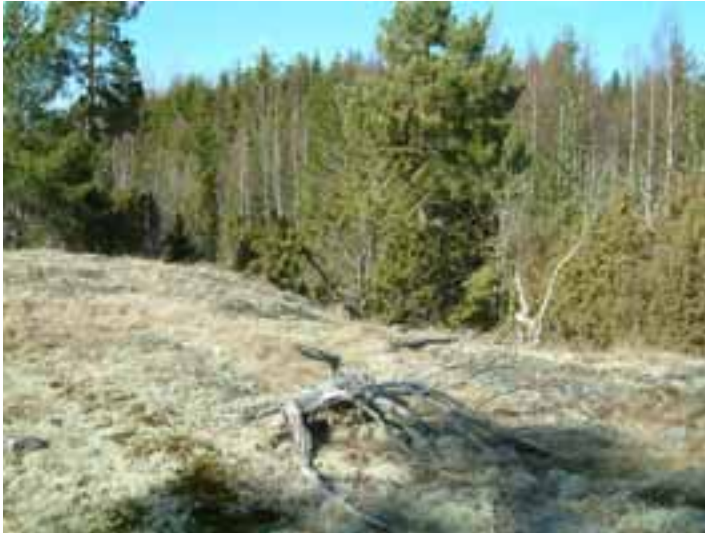
Vy från hällmark över nordöstra Hingsthagen (8). Tätt ung granskog med björkinslag.

samt för att öka mängden död ved lämnas på plats (åtgärd väljs med hänsyn till riskerna för insektsangrepp). Fäll/ringbarka ej varannat träd utan sträva efter luckighet och variation i beståndet. Lämna allt löv opåverkat. Skötseln utvärderas efter ca 10 år. Om fler åtgärder ej bedöms nödvändiga lämnas området för fri utveckling. Obs, en zon på 30 meter mot reservatsgränsen i öster lämnas orörd för att minska ev påverkan av insektsangrepp på angränsande skog.