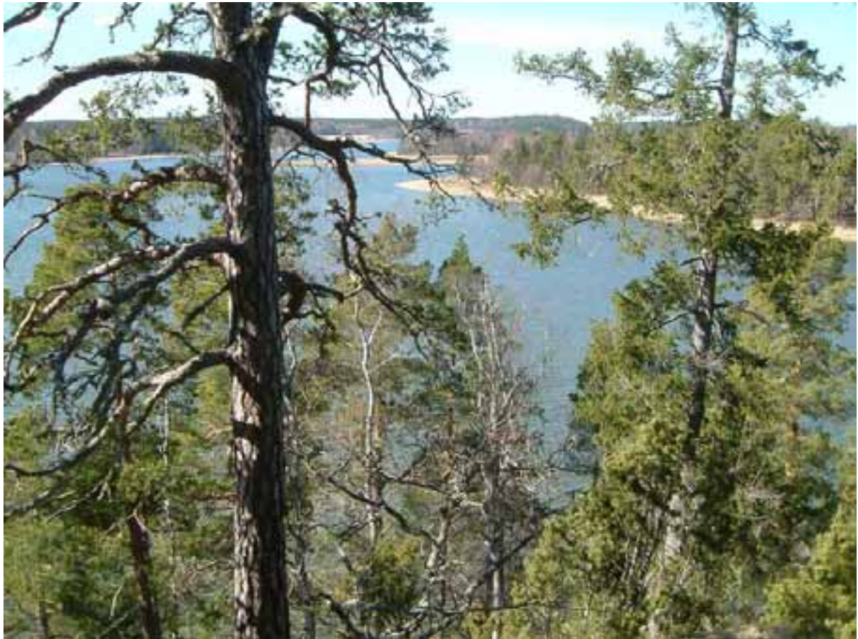
Från berget väster om Hingsthagen. T h Stjärnholmen. April 2005.