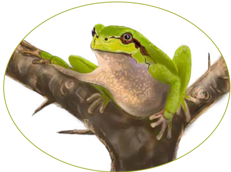
Lövgroda Hyla arborea

Därför kommer granplanteringarna ersättas av öppna marker med bok, ek och hassel, samt förhoppningsvis fler småvatten. I norr skapas en betesmark med enstaka ekar och hasselbuskar medan den södra delen kommer bli en gles, betad lövskog.