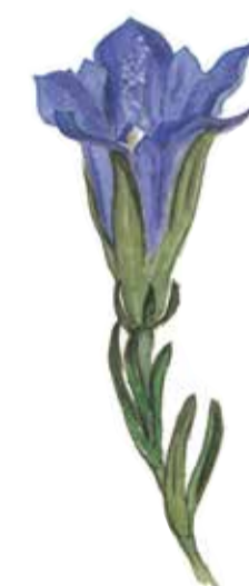
Klockgentiana ( Gentiana pneumonanthe ) kan man finna i betesmarkerna. Den användes förr mot lungsjukdomar.