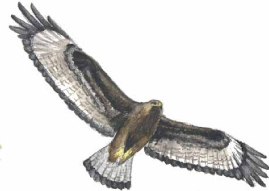
En Ormvråk ( Buteo buteo ) kan man få se segla över Frihult.