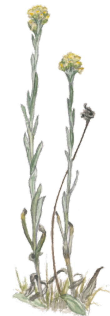
Hedblomster ( Helichrysum arenarium ) växer på de torra, solvarma, sandmarkerna.