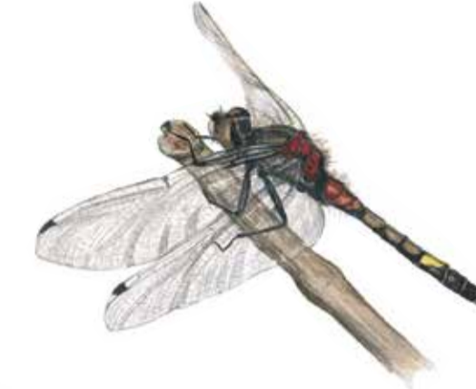
Citronfläckig kärrtrollslända ( Leucorrhinia pectoralis ) trivs vid växt- och näringsrika vatten. Hanen känns lätt igen på den citrongula fläcken på bakkroppen.