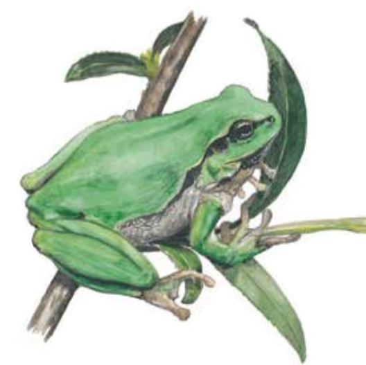
Lövgrodan ( Hyla arborea ) är duktig på att klättra i träd och buskar. Den är mycket högljudd. Vid ett besök en sen kväll i månads skiftet maj-juni vid en damm med lövgrodor kan den bjuda på en livlig konsert.

Frihult Nature Reserve is a part of a sandy moraine hilly landscape that was created from melting ice some 16000 years ago. The land has long been used by man for cultivation and grazing. There are grazing animals at the whole site today.