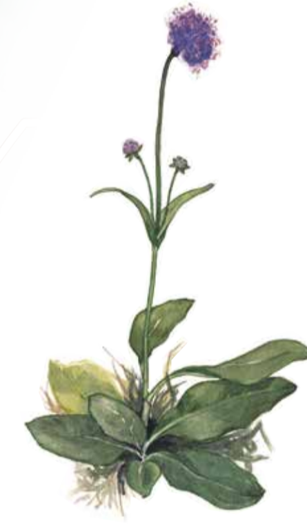
Ängsvädd ( Succisa pratensis ) Devil's bit scabious

Frihults naturreservat är del av ett sandigt moränbacklandskap som skapades av inlandsisen för cirka 16 000 år sedan. Marken har nyttjats av människor under lång tid för odling och som bete. I dag finns det betesdjur på praktiskt taget hela området.