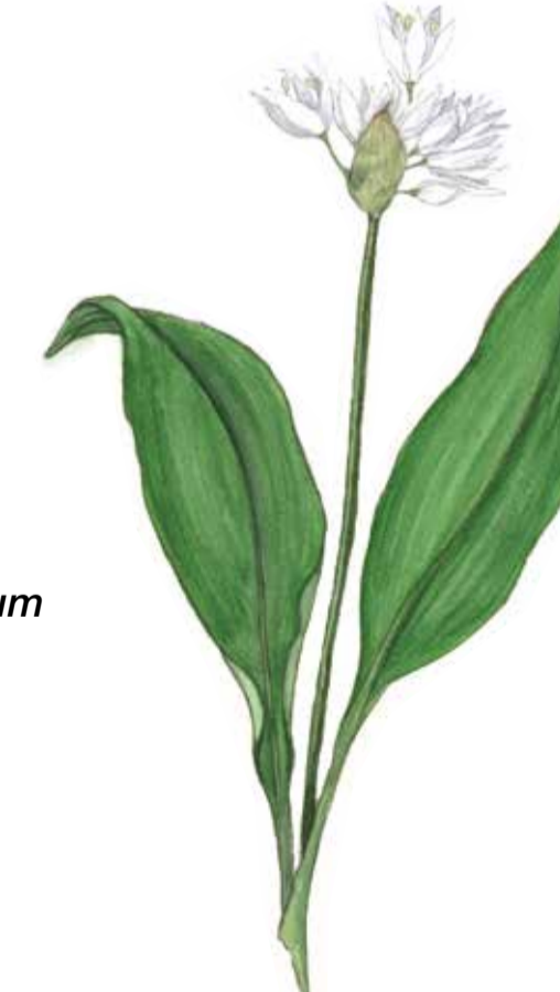
Ramslök Allium ursinum Wild garlic