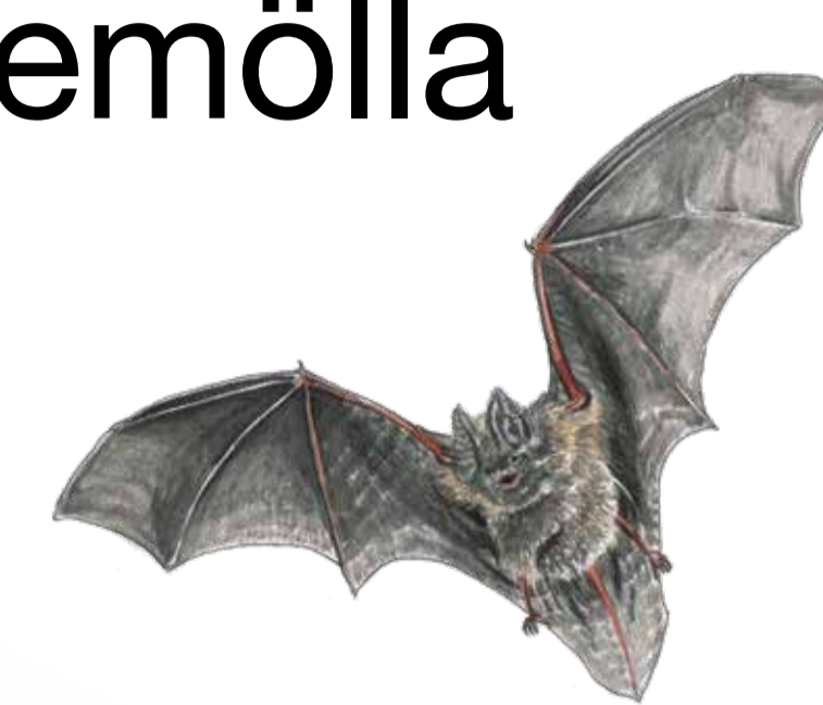
Barbastella barbastellus Barbastelle bat

Sträntemölla är en perfekt boplatser för fladdermusarten barbastell.