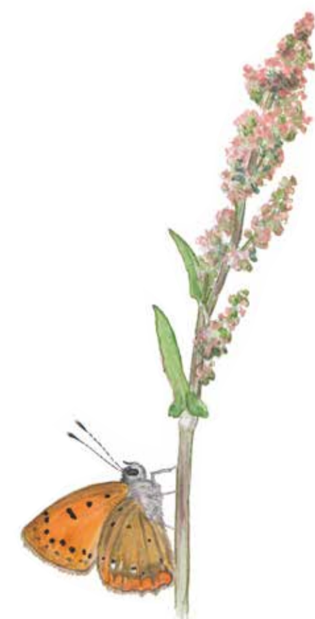
Vitfläckig guldvinge lägger sina ägg på ängssyra. Lycaena virgaureae Scarce copper butterfly

People and nature have cooperated well to create this varied and species rich landscape. On the sandy slopes, there are pastures intermingled with broadleaved woodland. The Södra Rörumsån River runs to the north, sometimes leisurely, sometimes rushing, with its high point at the waterfall by Forsemölla.