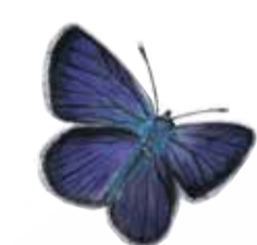
Ängsblåvinge Polyommatus semiargus Mazarine blue butterfly