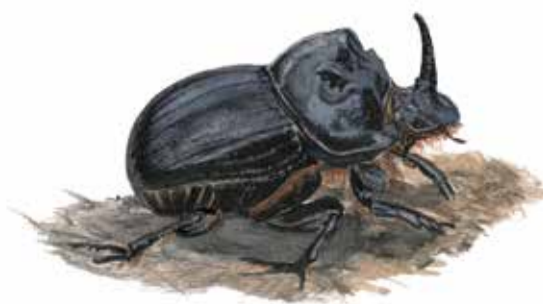
Månhornsbagge Copris lunaris Horned dung beetle

Den ovanliga hasselmusen håller till här i skogsbrynen där det finns buskar och sly som ger både mat och skydd. I de solvarma, sandiga betesmarkerna är det gott om både fjärilar och bin och den märkliga månhornsbaggen som lever sitt liv i kornas mockor.