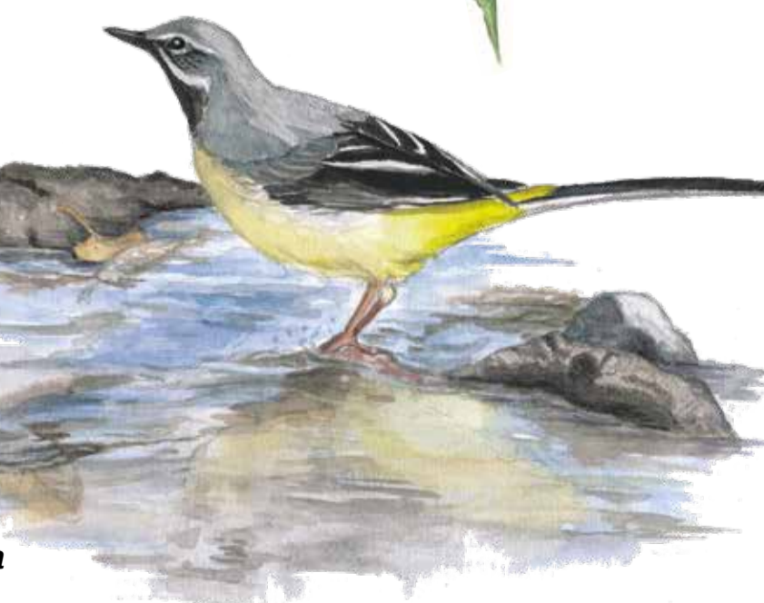
Forsärla Motacilla cinerea Grey wagtail