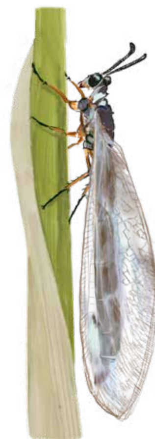
Liten myrlejonslända Myrmeleon bore Small antlion

Utan öppen sand att bygga fångstgropar i kan inte myrlejonsländan överleva.