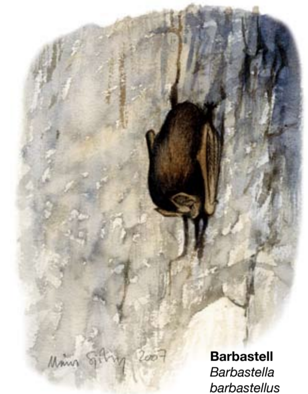
I de gamla gruvgångarna övervintrar flera olika arter fladdermöss, däribland vattenfladdermus, nordisk fladdermus och den mycket sällsynta barbastellen.

Rasrisk! Var vänlig respektera avspärningarna kring stupets brantaste delar. Utöver rasrisken är marken bitvis underminerad av gruvgångar.