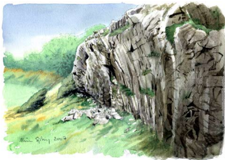
Impan är en förkastning, där marken sjunkit längs en spricka i berggrunden. Förkastningen bildades för 280-300 miljoner år sedan, under en tid då det fanns aktiva vulkaner i Skåne.

Betesmarkerna vid Impan är karga men artrika. Jordlagret är tunt och den hårda sandstenen ligger blottad på flera ställen. Själva stupet ligger i den västra delen och har fått ge namn åt hela reservatet.