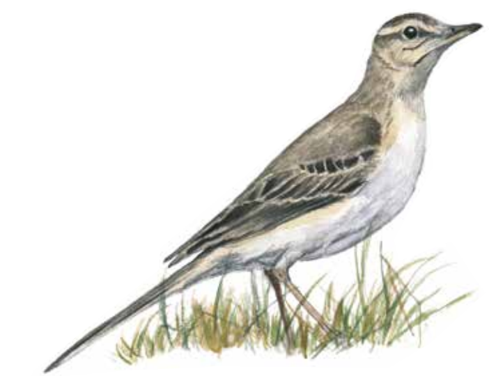
Fältpiplärka ( Anthus campestris ) är knuten till magra sandfält med öppna sandblottor och tuvor där den kan häcka i skydd.