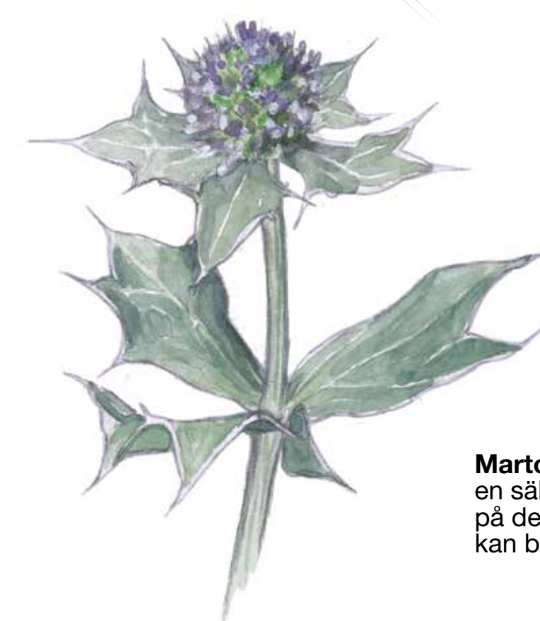
Martorn ( Ergyngium maritimum ) är en sällsynt växt som man kan finna på den sandiga havsstranden. Den kan bli 40 cm hög.