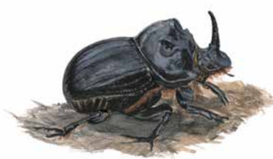
Månhornsbagge ( Copris lunaris ) är en dyngbagge som lever i kospilling på mycket torra, öppna, betesmarker. Var rädd om komockorna!

En vandring längs stranden för dig förbi Stenörens ålabod som minner om lång tradition med ålfiske. I nordkanten av reservatet finns Havängs utemuseum, Lindgrens Länga. Här kan du få veta mer om områdets natur och kultur.