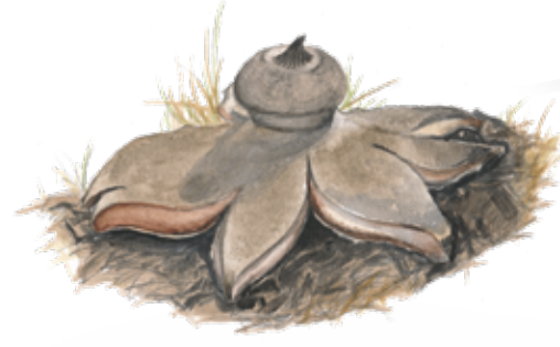
Sträv jordstjärna ( Geastrum berkeleyi ) är en av de sällsynta svampar som man kan finna på sandställen.