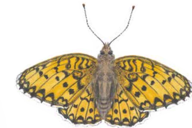
På de torra hedarna kan man finna fjärilar som Hedpärlormfjärilen ( Argynnis niobe ). Den lägger sina ägg på bl a styvmorsviol där också larverna utvecklas.