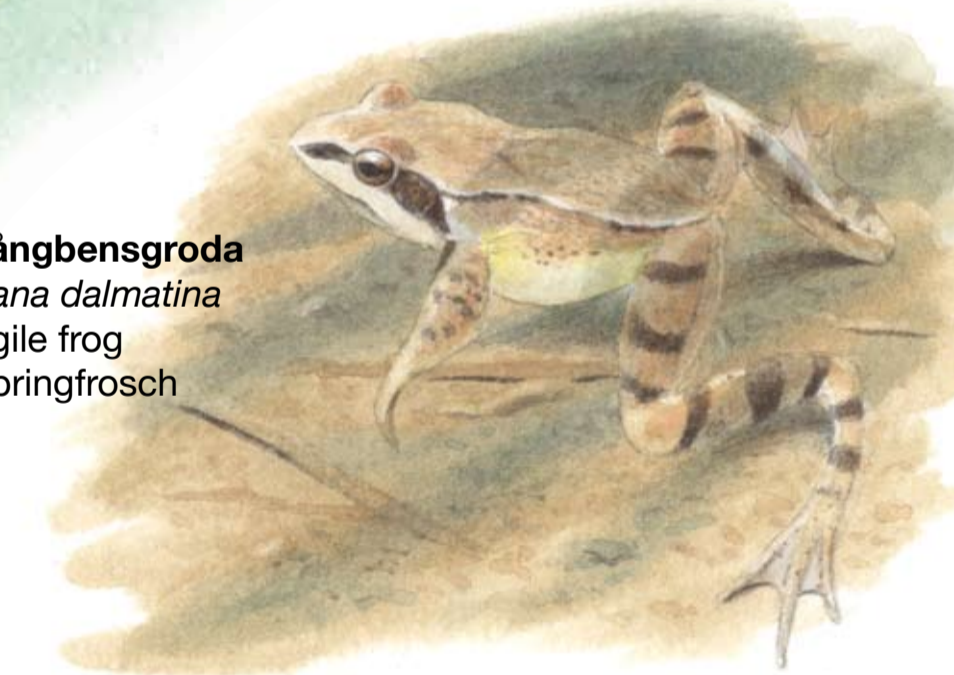
Långbensgroda Rana dalmatina Agile frog Springfrosch

I naturreservatet lever några av våra ovanligare groddjur: större vattensalamander, lövgroda och långbensgroda.