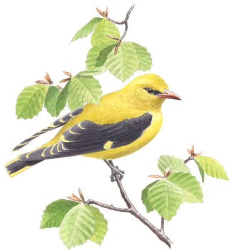
Sommargylling Oriolus oriolus Golden oriole Pirol

Många spännande växter och djur lever i skogarna runt Gyllebosjön.