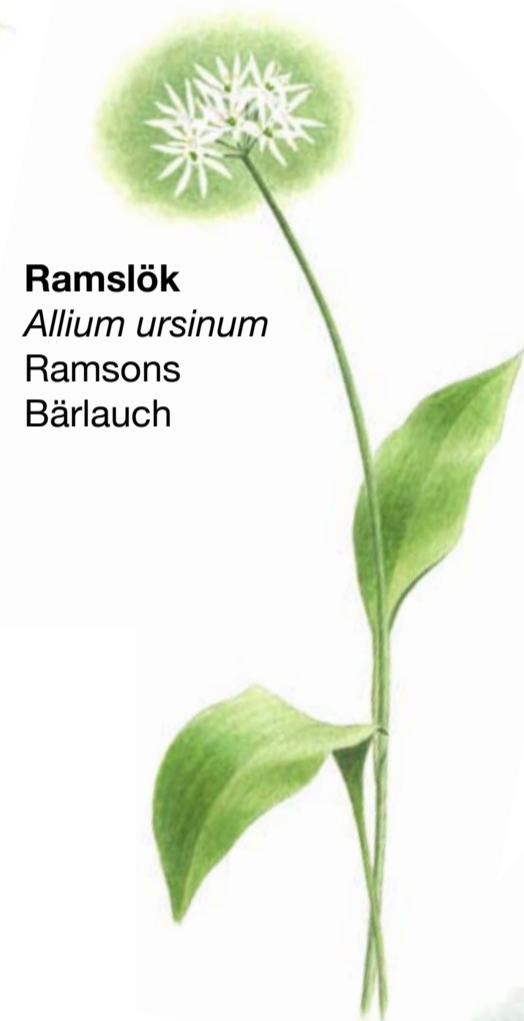
Ramslök Allium ursinum Ramsons Bärlauch

Många spännande växter och djur lever i skogarna runt Gyllebosjön.