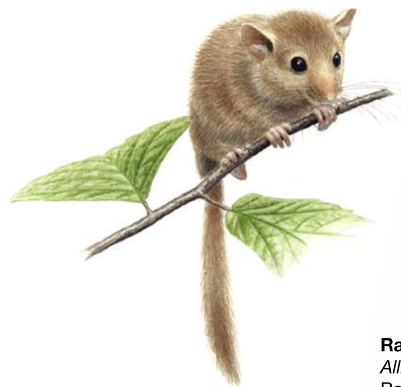
Hasselmus Muscardinus avellanarius Hazel dormouse Haselmaus