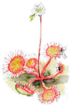
Rundsilshår Drosera rotundifolia