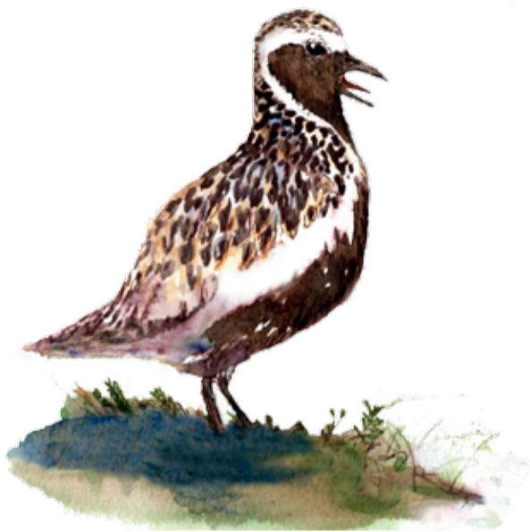
Ljungpipare, Pluvialis apricaria