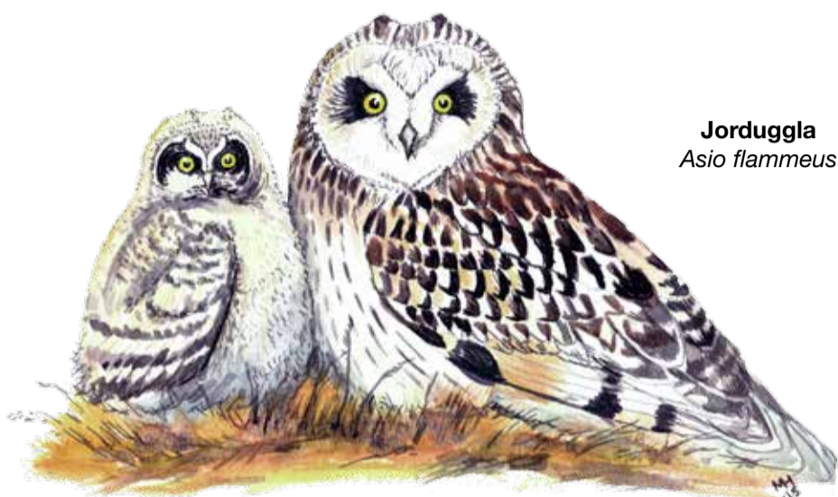
Jorduggla Asio flammeus