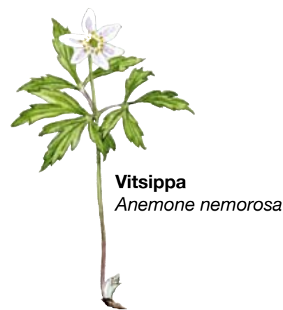
De flesta av bokskogens växter blommar innan trädens blad slagit ut.

Sibbarps skans. Osby skans, eller Sibbarps skans, är en försvarsanläggning som byggdes 1611, då Skåne tillhörde Danmark. Platsen var väl vald. Från höjden hade man bra utsikt över landsvägen och bron över Helge å som skulle bevakas mot inträngande svenska trupper. Mer information finns vid skansen, som ligger i reservatets norra del.