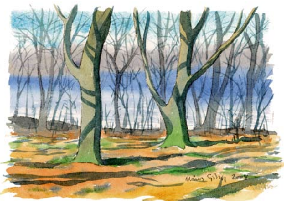
Bokskogen kring skansen har växt upp under 1900-talet. De äldsta träden har lågt sittande, grova grenar – ett växtsätt som visar att de växte upp då området fortfarande var ganska öppet.

Att skogen kring Sibbarps skans var en ekhage för bara hundra år sedan är svårt att föreställa sig. Och hur såg landskapet ut på 1600-talet? Från den tiden finns rester av en skans, som bör ha anlagts i ett öppet landskap eftersom avsikten var att bevaka landsvägen och passagen över Helge å.