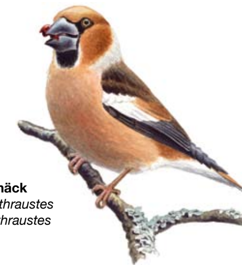
Stenknäck Coccothraustes coccothraustes

Stenknäcken förekommer vid Osby skansar. Den knäcker knappast sten med sin kraftiga näbb, men körsbärskärnor är en lätt match.