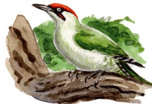
Gröngöling Picus viridis