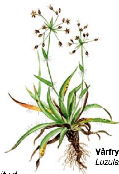
Vårfryle Luzula pilosa