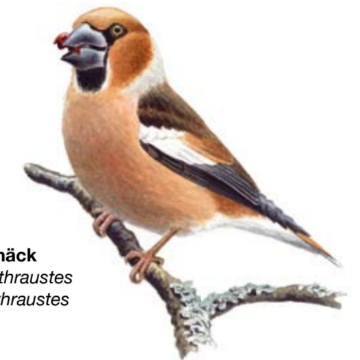
Stenknäck Coccothraustes coccothraustes

Stenknäcken förekommer vid Osby skansar. Den knäcker knappast sten med sin kraftiga näbb, men körsbärskärnor är en lätt match.