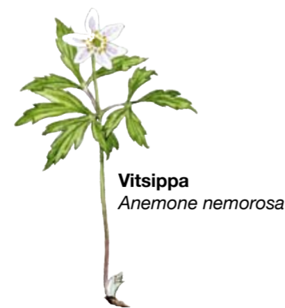
De flesta av bokskogens växter blommar innan trädens blad slagit ut.

Sibbarps skans. Osby skans, eller Sibbarps skans, är en försvarsanläggning som byggdes 1611, då Skåne tillhörde Danmark. Platsen var väl vald. Från höjden hade man bra utsikt över landsvägen och bron över Helge å som skulle bevakas mot inträngande svenska trupper. Mer information finns vid skansen, som ligger i reservatets norra del.