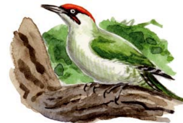
Gröngöling Picus viridis