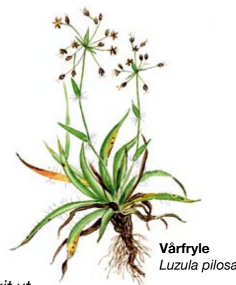
Vårfryle Luzula pilosa