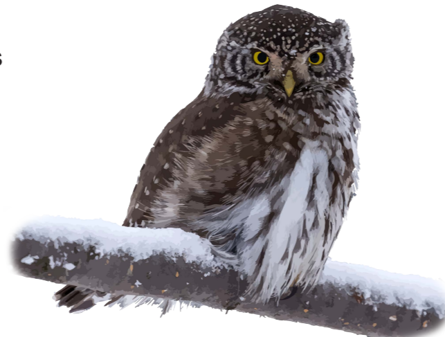
Sparvuggla Glaucidium passerinum