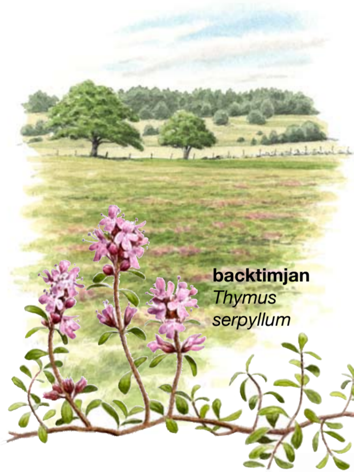
backtimjan Thymus serpyllum