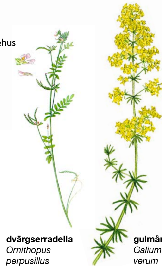
dvärgserradella Ornithopus perpusillus

Reservatets fåglar. I en bäckravin i öster växer skog rik på hassel. Här finns gott om mat för den mindre vanliga nötkråkan. Glada är en vanlig syn i reservatet och med lite tur kan du också få se övervintrande kungs- och havsörn.