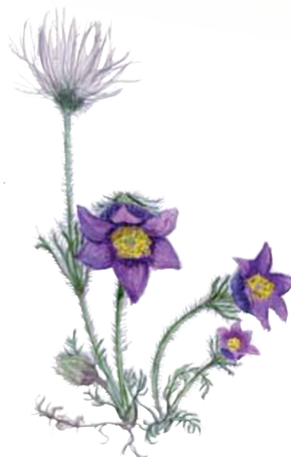
Backsippans ( Pulsatilla vulgaris ) lila klockor kan slå ut redan i april.