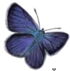
Ängsblåvinge Dendrocopos minor