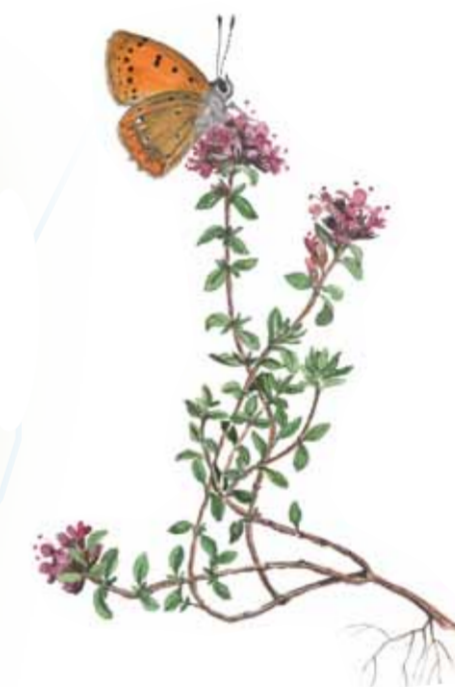
Backtimjan ( Thymus serpyllum ) med vitfläckig guldvinge ( Lycaena virgaurea ).