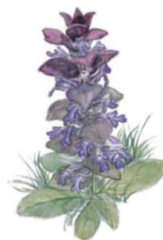
Blåsuga Ajuga pyramidalis