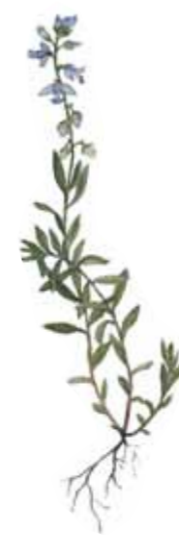
Jungfrulin Polygala vulgaris