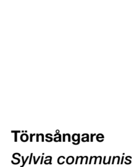
Törnsångare Sylvia communis

I dagens naturreservat ska de betande djuren och röjningar göra så att vi kan fortsätta njuta av denna vackra rest av ett gammalt, vidsträckt beteslandskap.