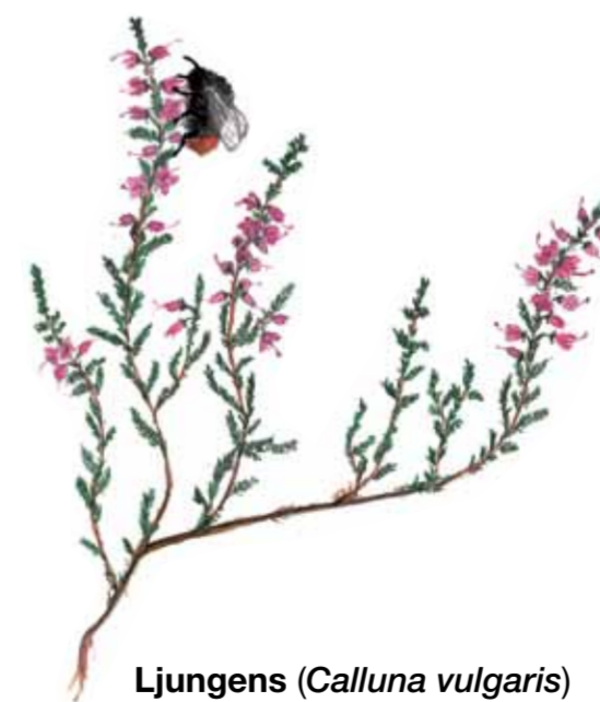
Ljungens ( Calluna vulgaris ) rosa-lila blommor ger färg åt betesmarken på sensommaren.

Enen ( Juniperus communis ) är en karaktärsart på Romeleåsens gamla fäladsmarker. I och under de taggiga snåren kan törnsångaren och gulsparrven gömma sina bon.