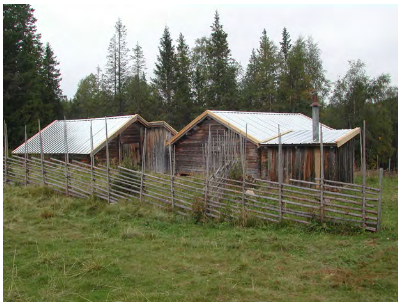
Figur 1. Svedbovallen.

En fäbodvall är en samlingsplats för betade husdjur med tillhörande stugor, fäboddar och fähus. Förr förde man boskapen hit för att beta, ofta fritt på skogen, under sommarhalvåret. Efter kvällsmjolkning blev boskapen inhyst i fähus där de under natten fick skydd från myggor, knott och rovdjur. Fäboddriften var förr ett nödvändigt komplement till driften på hemgården, som vanligen inte kunde sörja för