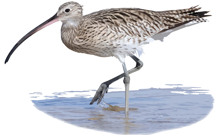
Storspov Numenius arquata

Vass- och videbuskmarkerna i norr kommer i dagsläget inte att restaureras. De bildar en stor sammanhängande yta tillsammans med liknande marker inom Hercules naturreservat och bedöms som viktiga för olika igenväxnings-gynnade arter. T.ex trivs rördrom, brun kärrhök och rosenfink här.