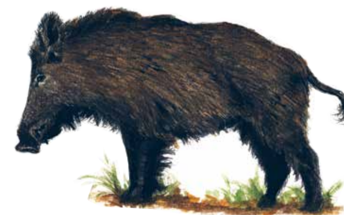
Sedan man slutat släppa ut tamsvinen i ollonskogen har vildsvinen ( Sus scrofa ) tagit över markbearbetningen.