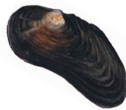
Flodpärlmussla ( Margaritifera margaritifera ) är mycket nogräknad med vattenkvaliteten och känslig för föroreningar. Larverna parasiterar nio till tio månader på gälarna av lax eller öring, fiskar med höga krav på friskt vatten. Föroreningar och ett tidigare pärlfiske har gjort musslan sällsynt men den finns fortfarande i Vramsån.

Väl synliga kulturlämningar i Olarpsreservatet är de många, ofta raka, stengårdsgårdarna. Det kan antas att de inte i första hand varit avsedda som hägnader för att hålla betesdjuren borta från odlingsmark utan utgjort gränsmarkeringar mellan byarna.