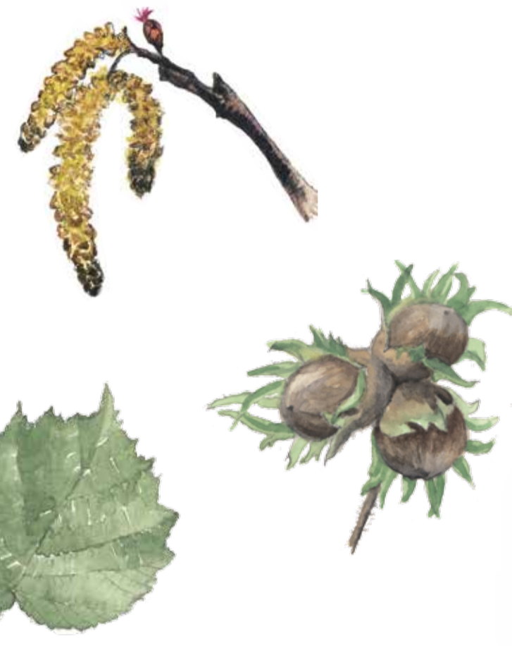
Hassel ( Corylus avellana ) Hanblommorna är de stora hängena och överst på kvisten ser man den lilla vackra honblomman som är ett av våra allra tidigaste vårtecken. Den slår ut strax efter att hängena som ansatts redan under hösten, har börjat svälla upp och gulna av frömjöl. Tag gärna med en lupp!

Olarps naturreservat bjuder på vandring i gamla utmarker till Olarps by. Här släppte man korna på bete i skogen och svinen fick ströva fritt i jakt på bokollon, svamp, larver och sorkar som gjorde dem feta och gav smak åt fläsket. I dag är det vildsvinen som får njuta av ollonen.