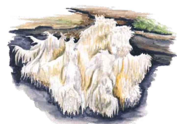
Koraltaggsvamp ( Heridium coralloides ) är mycket sällsynt men har hittats på en död bokstam i Olarp