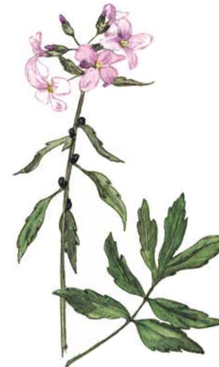
Tandrot ( Cardamine bulbifera ) växer i ek och hasselskogen. Den har sitt namn efter den fjälliga jordstammen. I bladvecken bildar den små bruna groddknoppar som faller till marken och växer upp till en ny planta.

Olarps Nature Reserve provides walking in the traditional grazing areas associated with the village of Olarp. This is where the cows were put out to pasture in the woodlands and the pigs wandered freely on the hunt for beech nuts, fungi, larvae and voles, which made them fat and gave the pork flavour. Today the wild boars ( Sus scrofa ) enjoy the beech nuts.