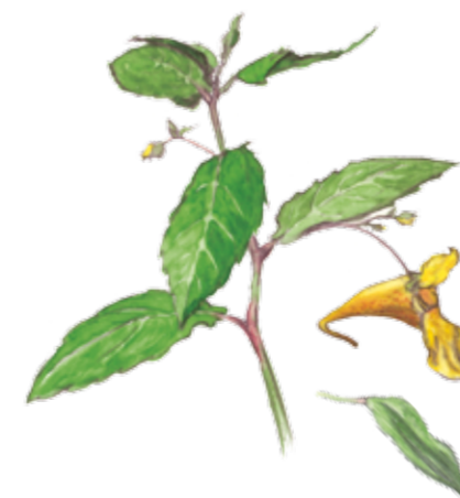
Springkornets ( Impatiens noli-tangere ) frukt är som en liten kanon. När den är mogen avfyrar den sina frön med full kraft om man rör vid den.