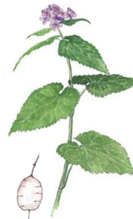
Månviolens ( Lunaria rediviva ) frökapsel ser ut som en skir silverpeng framåt hösten.