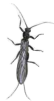
Bäcksländan Capnia Bifrons