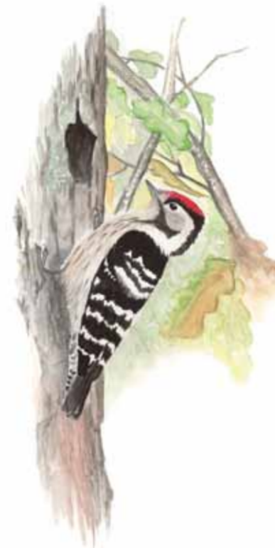
Mindre hackspett Dendrocopos minor