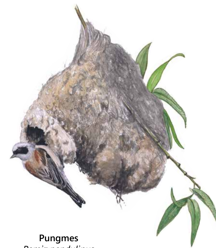
Pungmes Remiz pendulinus Penduline tit

Flooded meadows. The highest parts of Isternäset were in the past used for cultivation, and other areas have been grazed over long periods. The wetland vegetation is adapted to seasonal flooding. Some rare plants found here include fen ragwort and a species that Carl Linnaeus discovered on his visit in 1749 – fine-leaved water dropwort.