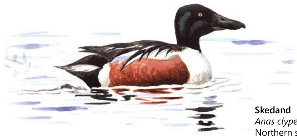
Skedand Anas clypeata Northern shoveler

Större delen av reservatet består av betade strandängar längs Helgeå. I söder finns igenväxta områden med vass och videbuskage. Området är mest känt för sitt rika fågelliv. I området häckar vadarfåglar som storspov, tofsvipa, rödbena och den sällsynta rödspoven, tillsammans med skedand, årta, och gulärla.