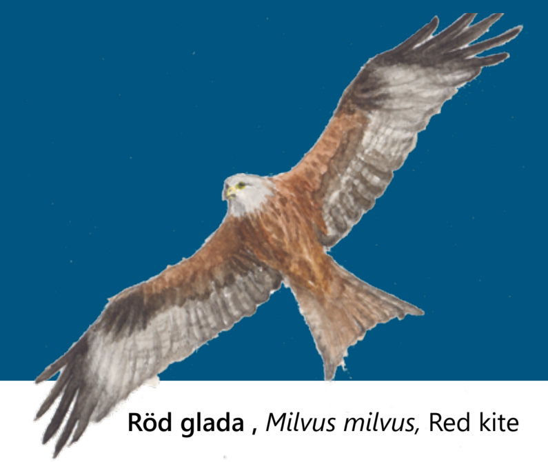
Röd glada, Milvus milvus , Red kite