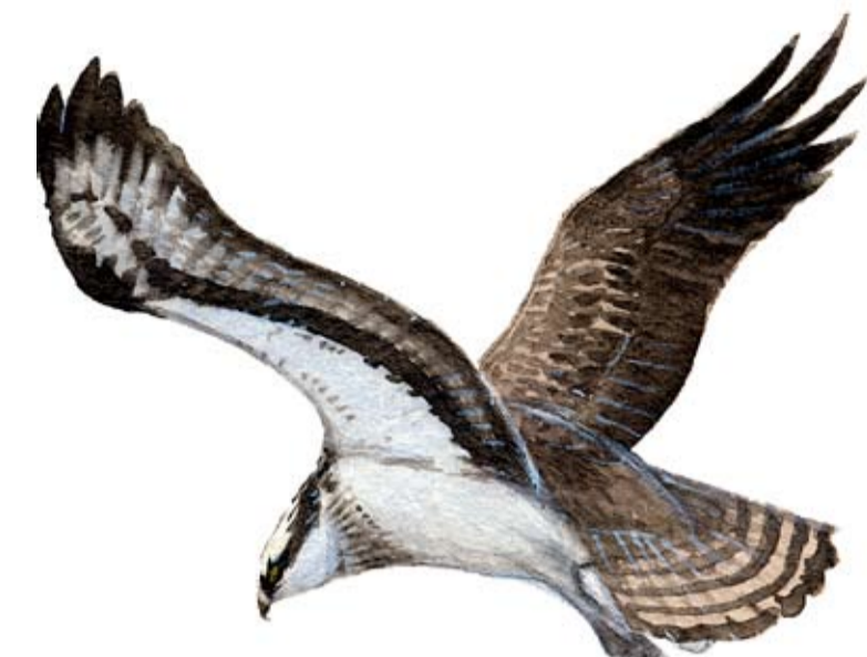
Fiskgjuse Pandion haliaetus Osprey Fischadler

Sjön Immeln är fiskgjusens och storlommens sjö. I övriga Skåne är de ovanliga, men vid Immeln finns chans att se dem då de häckar mellan april och juli.