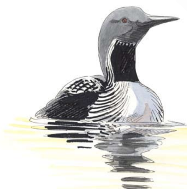
Storlom Gavia arctica Black-throated loon Prachtttaucher

Welcome to Brotorpet Nature Reserve along the shores of Lake Immeln. Here you'll find old beech forest, where the trees are left to die naturally. Old and dead trees provide food for a large number of insects, which in turn become food for woodpeckers and other birds. Brotorpet is situated in an area with many lakes, sometimes called "the last wilderness in southern Sweden". Lake Immeln and the adjacent lakes are highly ranked by canoeists and popular among anglers. The lakes also belong to black-throated diver and osprey. The sad call of the black-throated diver can be heard over the water in late spring evenings and nights. Both black-throated diver and osprey are sensitive to disturbances and leave their nests when humans approach. Therefore, avoid disturbing them in their nesting sites.