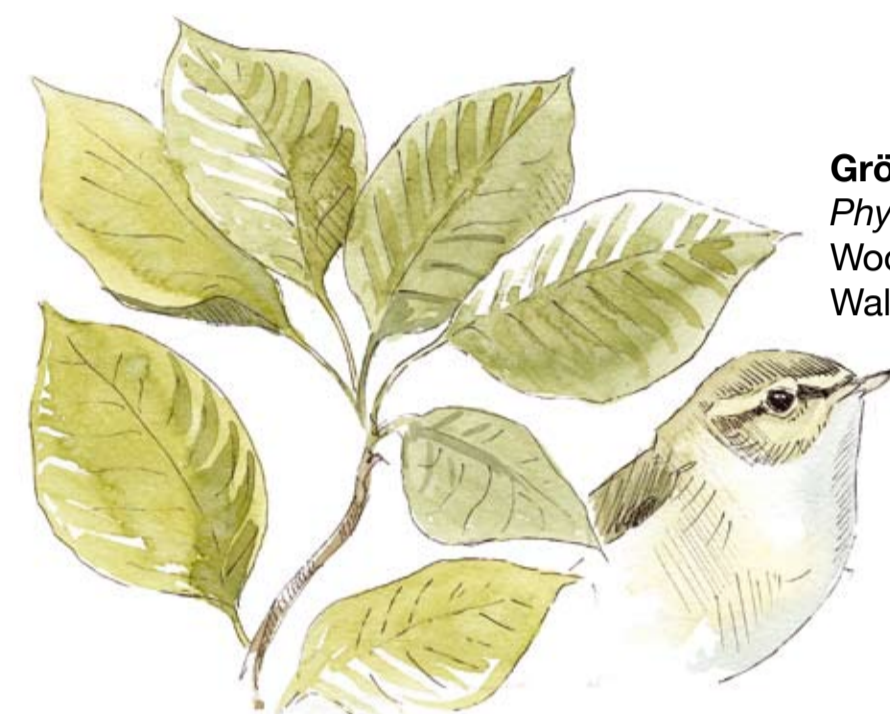
Grönsångare Phylloscopus sibilatrix Wood warbler Waldlaubsänger

Sjön Immeln är fiskgjusens och storlommens sjö. I övriga Skåne är de ovanliga, men vid Immeln finns chans att se dem då de häckar mellan april och juli.