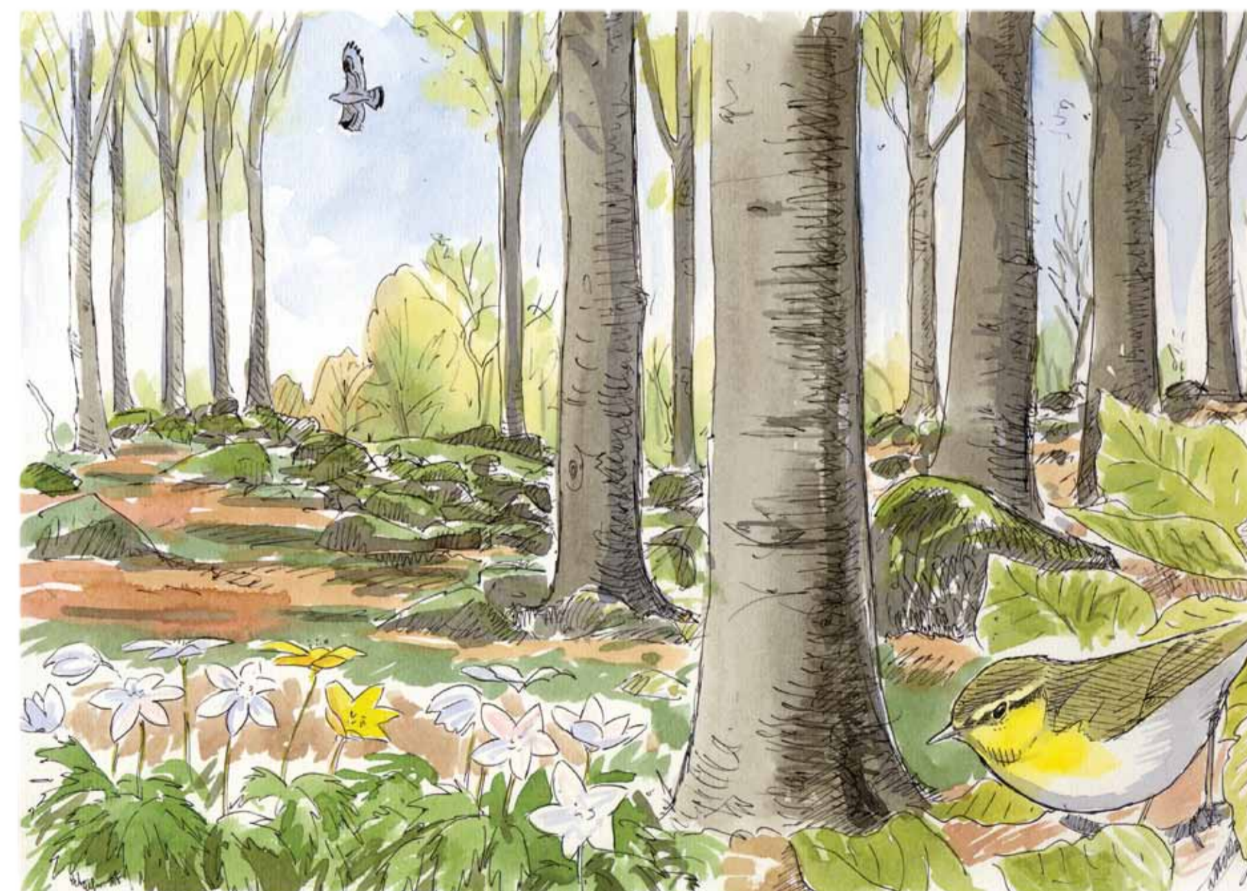
Grönsångaren är vanlig i Balsbergets skogar och bivrak är en av de rovfåglar man kan få se. Teckning: Peter Elfman.

På Balsberget kan man stöta på både rådjur, älg och dovhjort, vid enstaka tillfällen till och med kronhjort. De idag talrika vildsvinen är skygga, men spåren efter dem är tydliga, där de bökar upp marken i sin jakt på något ätbart. Området har också ett rikt fågelliv med förekomst av många arter. Här häckar hålbbyggande fåglar som spillkråka, mindre hackspett, grön göling och skogsduva men också grönsångare, stjärtmes, törnskata, entita, stenknäck och bivrak.