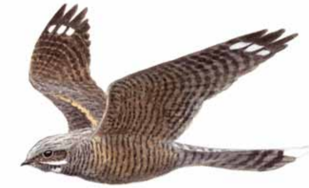
Nattskär Caprimulgus europaeus Nightjar Ziegenmelker

Willkommen im Naturschutzgebiet Traneröds mosse, Grindhus und Lilla Klåveröd. Das weitläufige Hochmoor hat eine vielfältige Vogelfauna mit Arten wie Ziegenmelker, Mäusebussard und Großem Brachvogel. Bei Lilla Klåveröd und Grindhus sind jahrhundertalte Anbauflächen und andere Relikte vergangener Zeiten zu sehen. Die Flora mit Arnika, Wald-Läusekraut, Gemeiner Kreuzblume und Zittergras profitiert vom Mähen und der Beweidung.