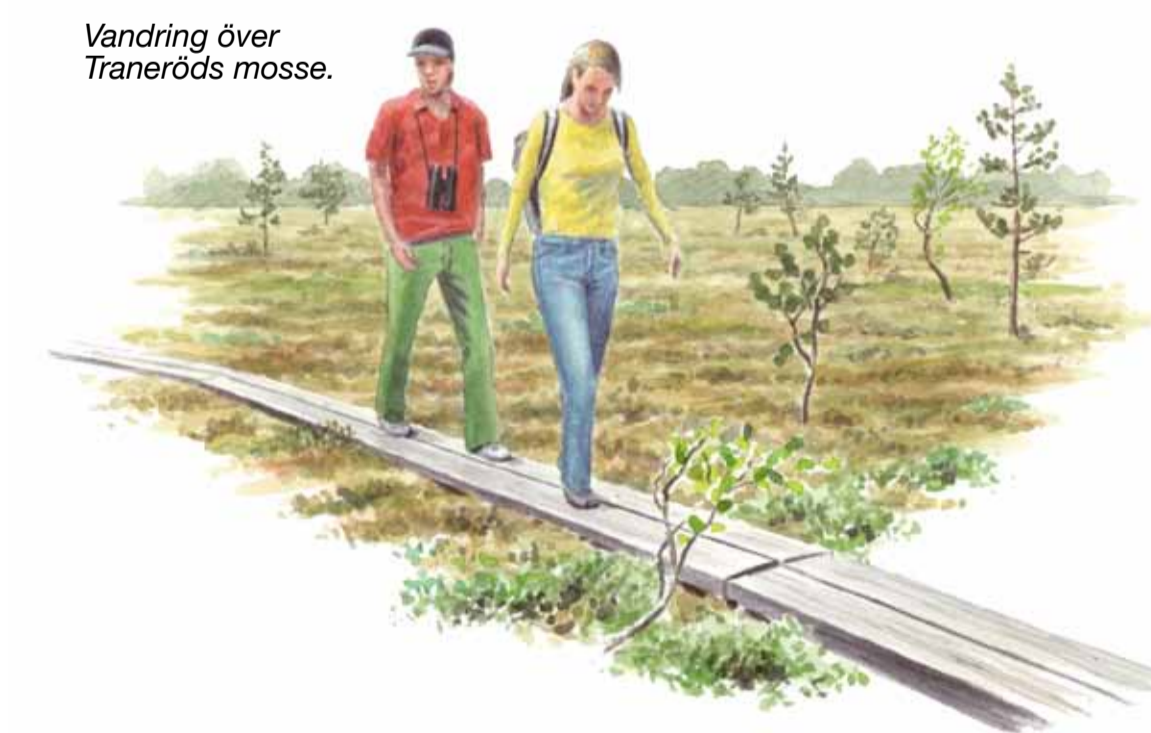
Vandring över Traneröds mosse.

Åtgärder för ökad mångfald. Inom ramen för EU-projektet "Life to ad(d)mire" har flera restaureringsåtgärder utförts på mossen. Diken har lagts igen för att återställa mossens ursprungliga vattenbalans och träd och buskar har röjts bort för att hindra igenväxning.