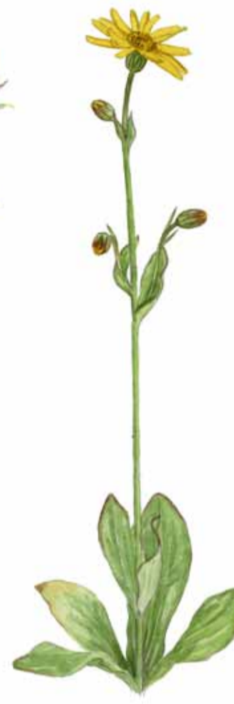
Slättegubbe Arnica montana Mountain arnica Arnika