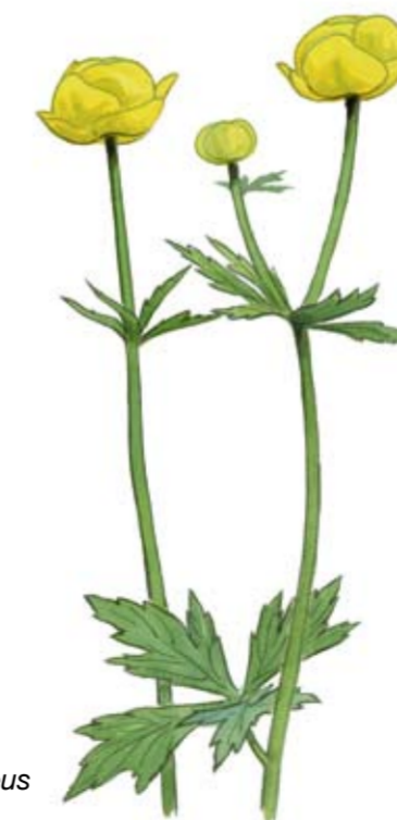
Smörbollar Trollius europeus