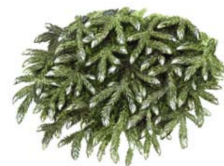
Fällmossa Antitrichia curtipendula är en mindre vanlig mossa som växer i tjocka mattor på stenar och trädbaser.