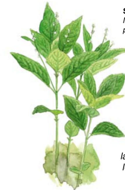
Skogsbingel Mercurialis perennis

Skogsbingeln finns avbildad på den svenska 100-kronors-sedeln efter en originalteckning av Carl von Linné. Den har han- och honblommor på skilda plantor och spelade en stor roll då Linné formulerade sina djärva teorier om att även växter har ett sexliv.