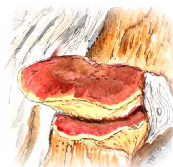
Oxtungsvamp Beefsteak fungus Fistulina hepatica