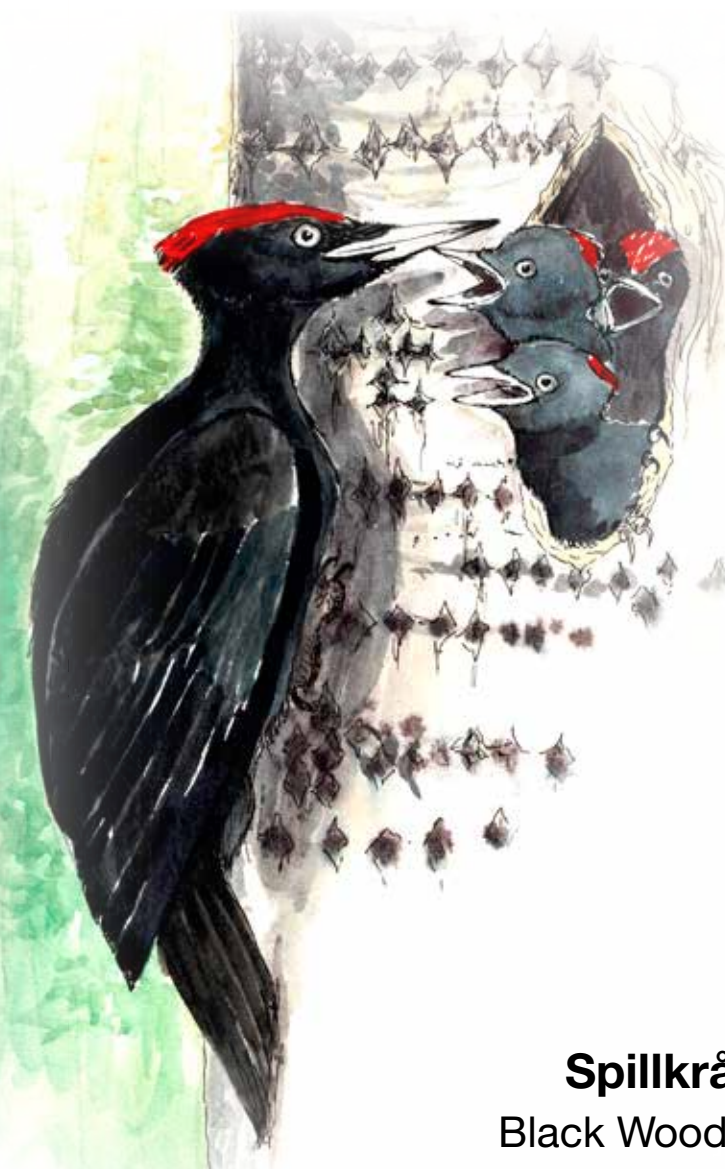
Spillkråka Black Woodpecker Dryocopus martius

Today Tollaskogen is an exciting deciduous forest. The wetland forest is dominated by common alder. In other parts beech, oak and pine grows. The oldest trees are around 130 years old. The forest has high biodiversity due to its rich variety in tree species. The beetle hypulus quercinus which is 5 to 6 mm long is one of many species that is depending on dead wood. It lives in dead oak trees, especially dead wood infested with Oak Curtain Crust fungus ( Hymenochaete rubiginosa ). In the old dying oak trees in the area, you can also find the beautiful Red Beefsteak fungus. Far to the south lie wooded pastures where animals graze amongst flowering shrubs and old oak trees.