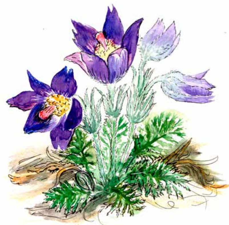
Backsippa Pasqueflower Pulsatilla vulgaris