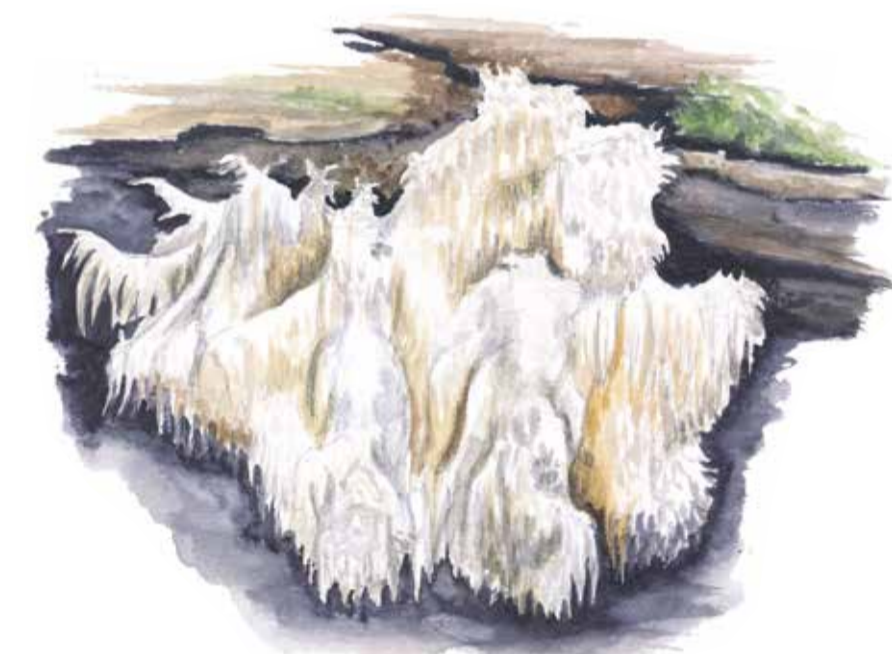
Koralltaggsvampen följer i fnösktickans fotspår när veden redan är rejält murken. Hericium coralloides Coral tooth fungus