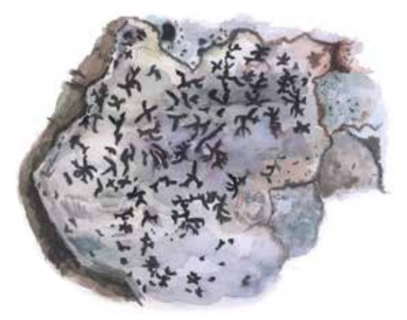
Stiftklotterlaven växer på gamla ädellövträd, oftast bok i Skåne. Opegrapha vermicellifera