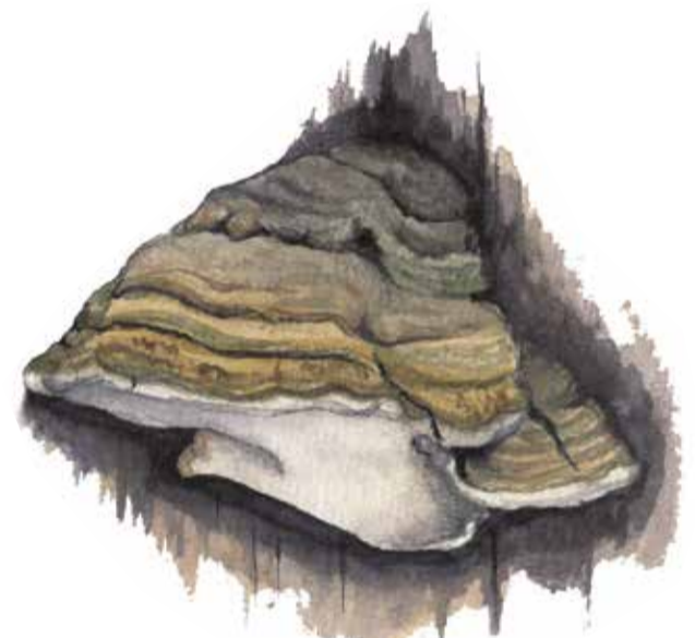
Fnöskticka Fomes fomentarius Tinder bracket fungus