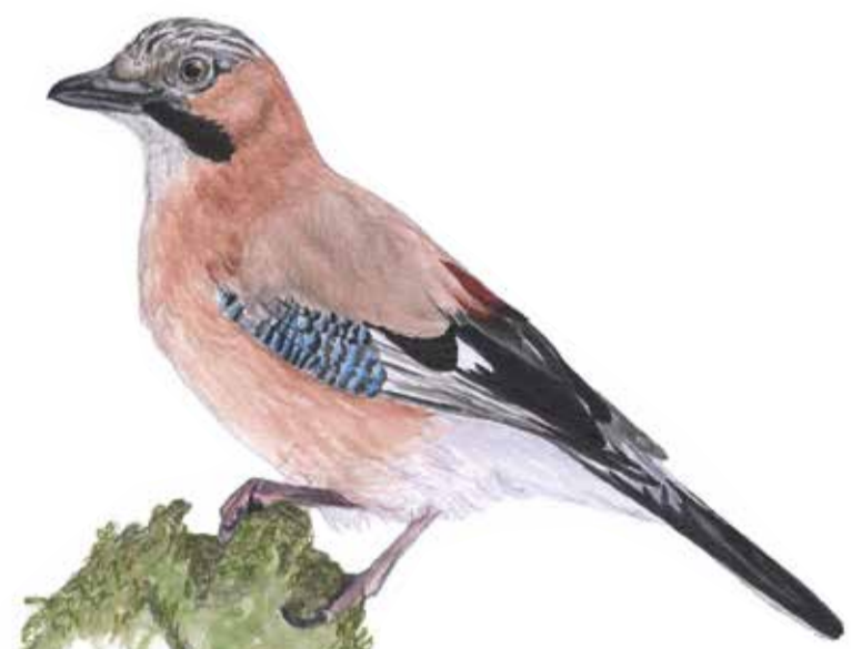
Nötskrikan hamstrar ekollon inför vintern. Ibland glömmen hon gömstället och en ny ek kan börja gro. Garrulus glandarius Jay