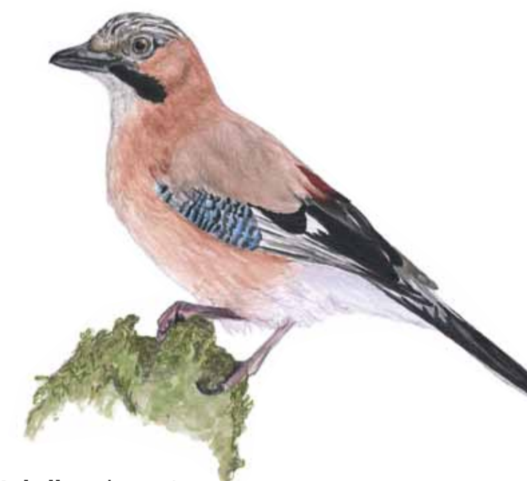
Nötskrikan hamstrar ekollon inför vintern. Ibland glömmar hon gömstället och en ny ek kan börja gro. Garrulus glandarius Jay