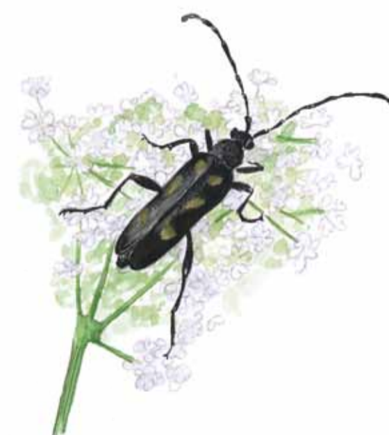
Den sexfläckiga blom- bockens larver lever i död ekved. Anoplodera sexguttata Six spotted longhorn beetle