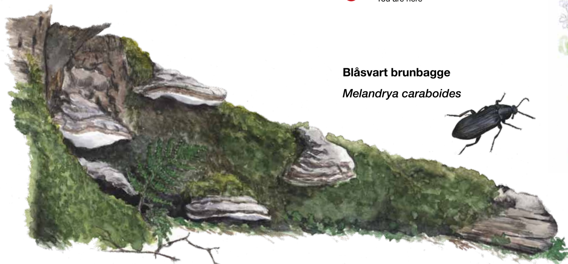
Blåsvart brunbagge Melandrya caraboides