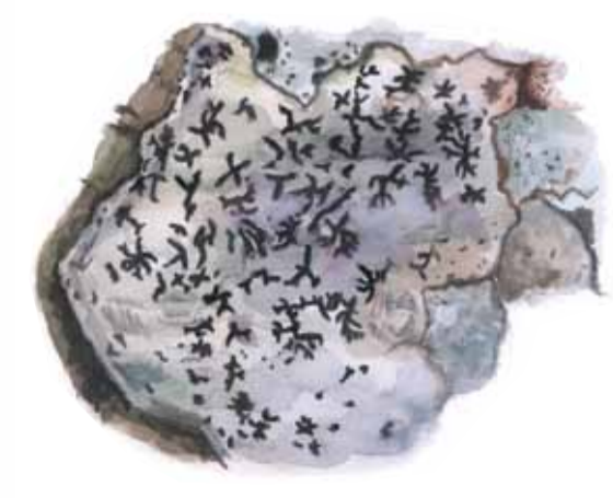
Stiftklotterlaven växer på gamla ädellövträd, oftast bok i Skåne. Opegrapha vermicellifera