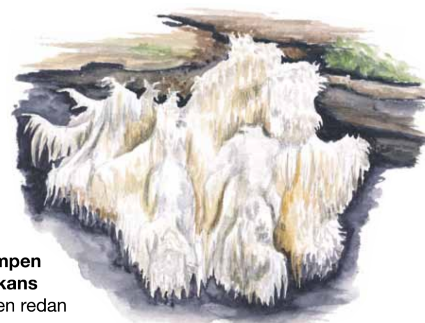
Koralltaggsvampen följer i fnösktickans fotspår när veden redan är rejält murken. Hericium coralloides Coral tooth fungus