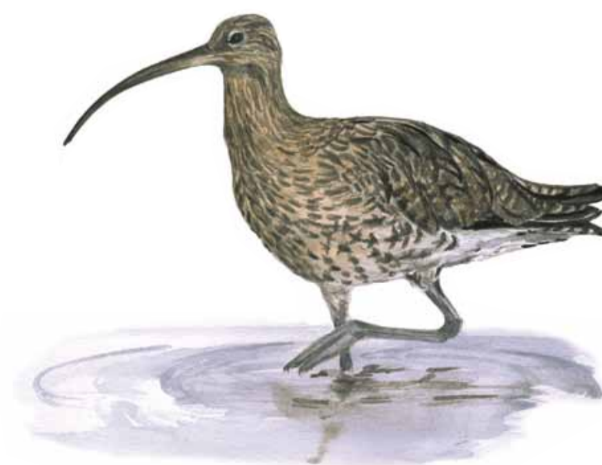
Storspov Numenius arquata Curlew