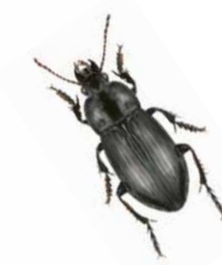
Skalbaggen smal frölopare blir inte större än 8 mm och är mest aktiv på natten.

0 50 100 200 Meter Länsstyrelsen Skåne, © Lantmäteriet