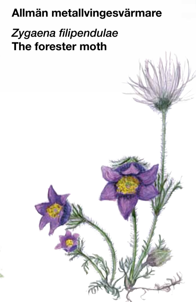
Backsippa Pulsatilla vulgaris Pasqueflower