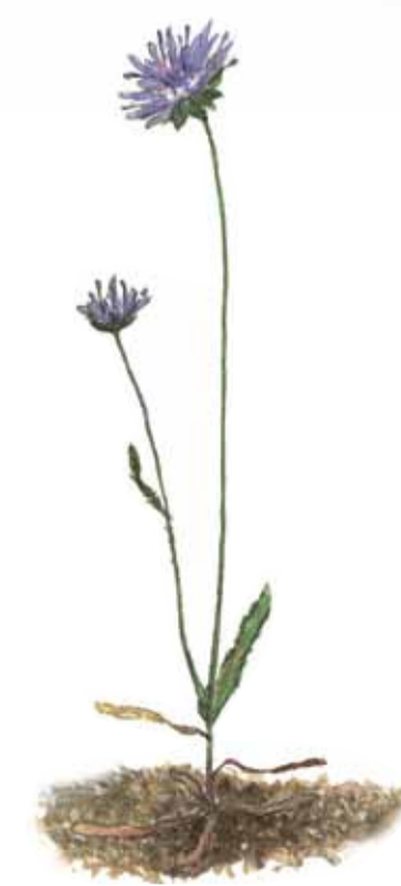
Blåmunkar Jasione montana Sheep's bit scabious