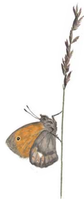
Kamgräsfjäril Coenonympha pamphilus Small heath butterfly