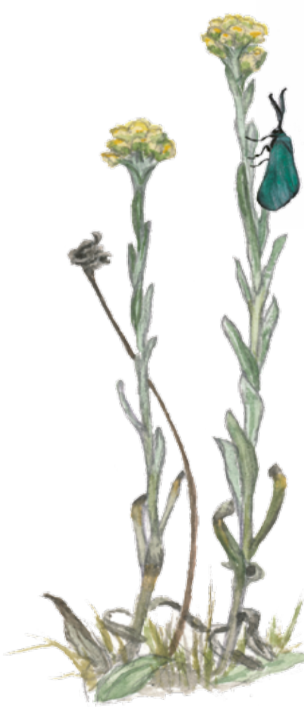
Hedblomster Helichrysum arenarium Dwarf everlasting