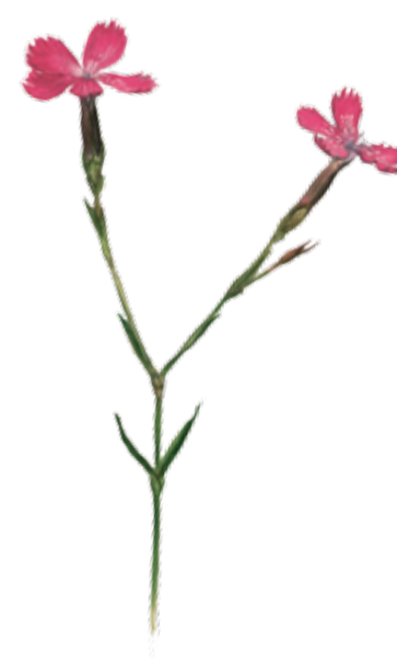
Backnejlika Dianthus deltooides Maiden pink