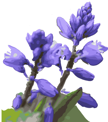
Jungfrulin Polygala vulgaris

Länsstyrelsen förklarade Abullahagen som naturreservat 1994. Området omfattar 38 ha. Syftet med reservatet är att med avseende på markhistoriska, kulturhistoriska och botaniska värden bevara en väl hävdad fäladsmark med tillhörande kärrområden och sjö samtidigt som området kan utnyttjas för rekreation och undervisning. Reservatet ingår i EU's ekologiska nätverk av skyddade områden, Natura 2000.