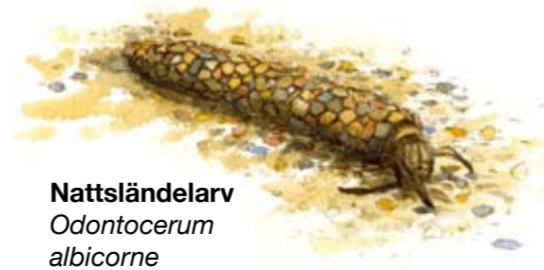
Nattsländelarv Odontocerum albicorne

I Axelstorpsbäcken finns larver av den sällsynta nattsländan Odontocerum albicorne , som bygger sitt hus av små sandkorn. Husbyggande nattsländelarver brukar kallas husmaskar och är strömstarens favoritföda.