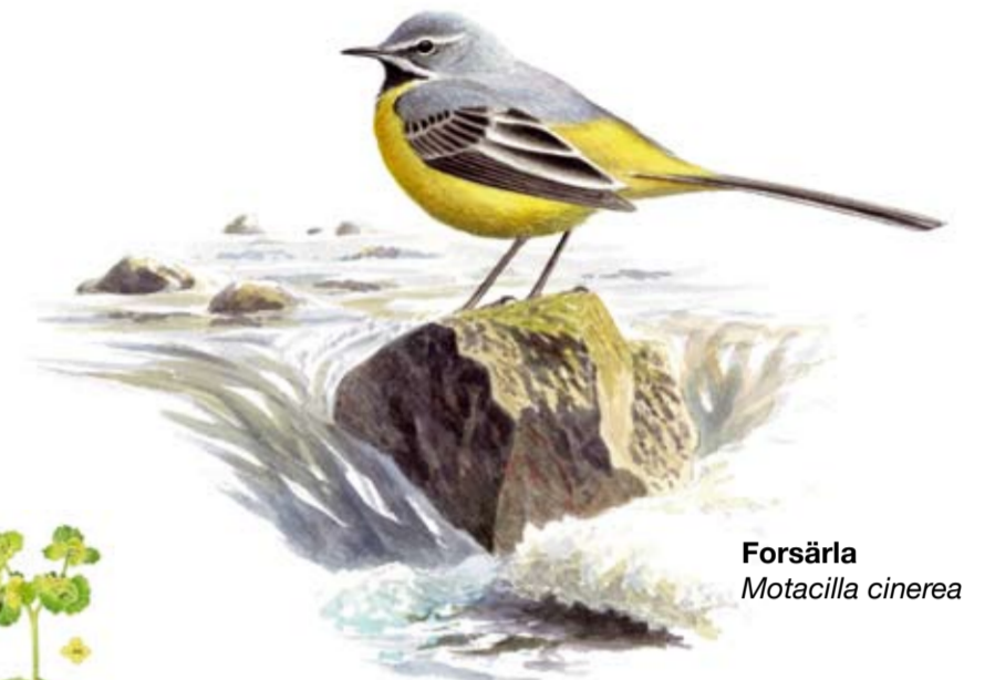
Forsärla Motacilla cinerea