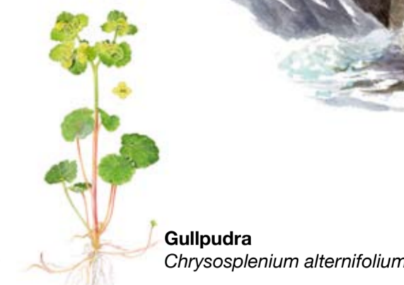
Gullpudra Chrysosplenium alternifolium