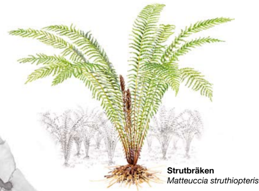
Strutbräken Matteuccia struthiopteris

I Axelstorpsbäcken finns larver av den sällsynta nattsländan Odontocerum albicorne , som bygger sitt hus av små sandkorn. Husbyggande nattsländelarver brukar kallas husmaskar och är strömstarens favoritföda.