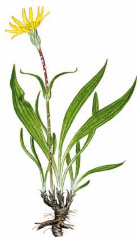
Svinrotens ( Scorzonera humilis ) stora blomma öppnar sig bara vid soligt väder. Blommar maj-juni.