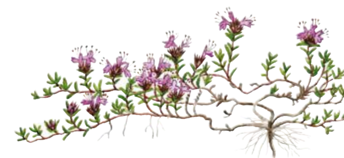
Den lilla växten backtimjan ( Thymus serpyllum ) bildar oftast låga, täta mattor. Blommar från juni till augusti.