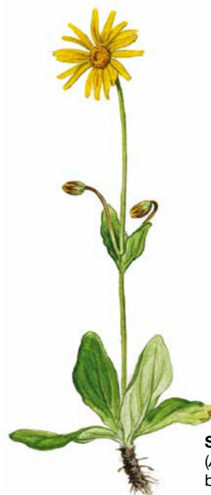
Slättegubben ( Arnica montana ) blommar i midsommartid.