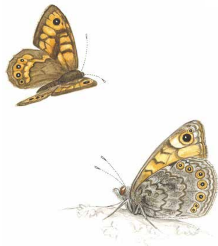
Svingelgräsfjärilen ( Lasiommata megera ), trivs i torrare marker, dess larv lever på gräs. Den vuxna fjärilen flyger i två generationer, maj-juni och juli-augusti.