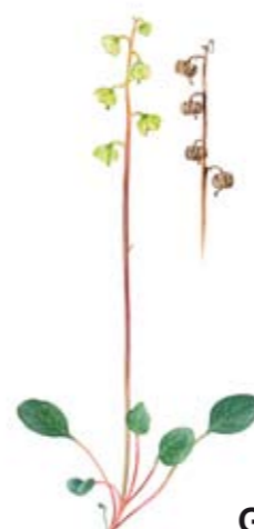
Grönpyrola Pyrola chloranta