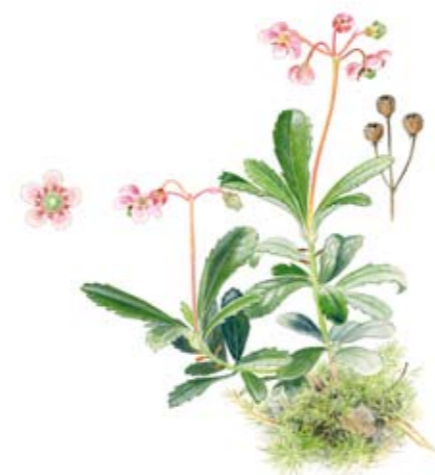
Ryl Chimaphila umbellata