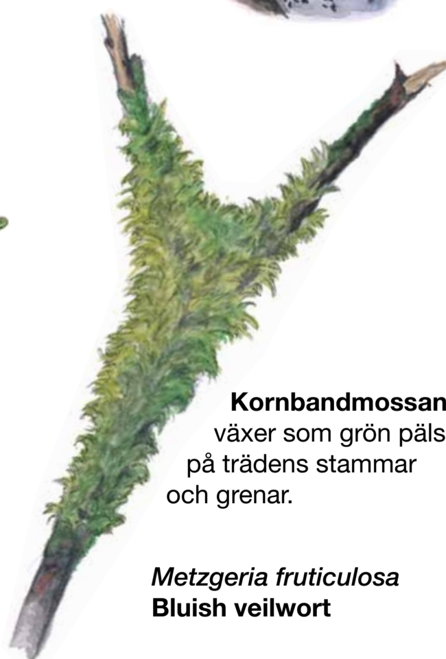
Kornbandmossan växer som grön päls på trädens stammar och grenar. Metzgeria fruticulosa Bluish veilwort