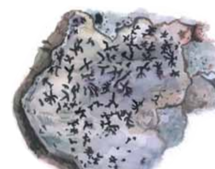
Stiftklotterlaven växer på gamla ädellövträd, oftast bok i Skåne. Opegrapha vermicellifera