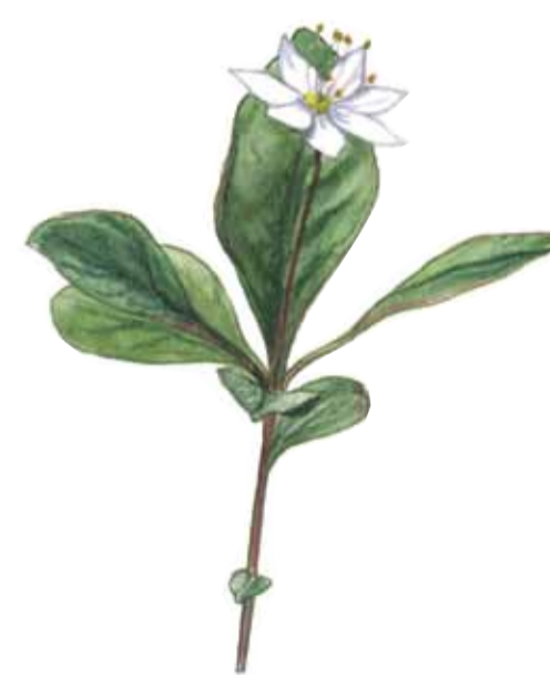
Skogsstjärna Trientalis europaea Chickweed wintergreen