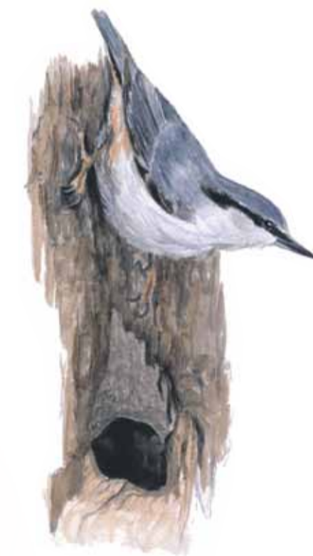
Den oblyga nötväcken bygger sitt bo i gamla hackspetthål. Är hålet för stort muras det till rätt storlek med lera.