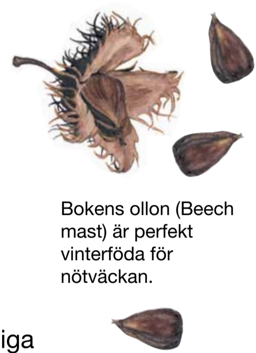
Bokens ollon (Beech mast) är perfekt vinterföda för nötväcken.

The woodland on the steep slopes has an old-growth character. The humidity is high and fungi, lichens and mosses thrive here. One example includes the rare moss bluish veilwort, which grows on the trunks of broadleaved trees, in dense, damp woodland. The beech woodlands in Näsums Bokskogar are allowed to develop freely – young trees need to get along with old and dead trees.