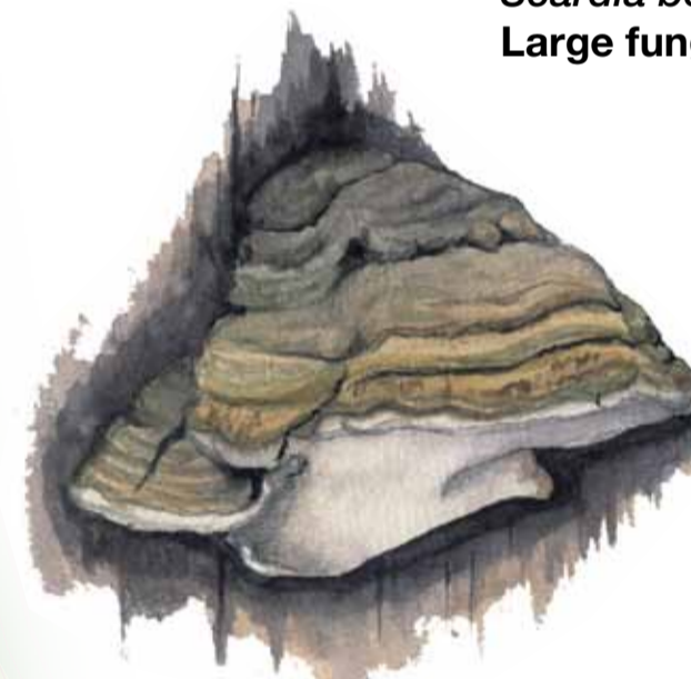
Fnösktickan erbjuder bostad åt larven till en stor malfjäril, jättesvampmalen. Fnöskticka Fomes fomentarius Tinder bracket fungus