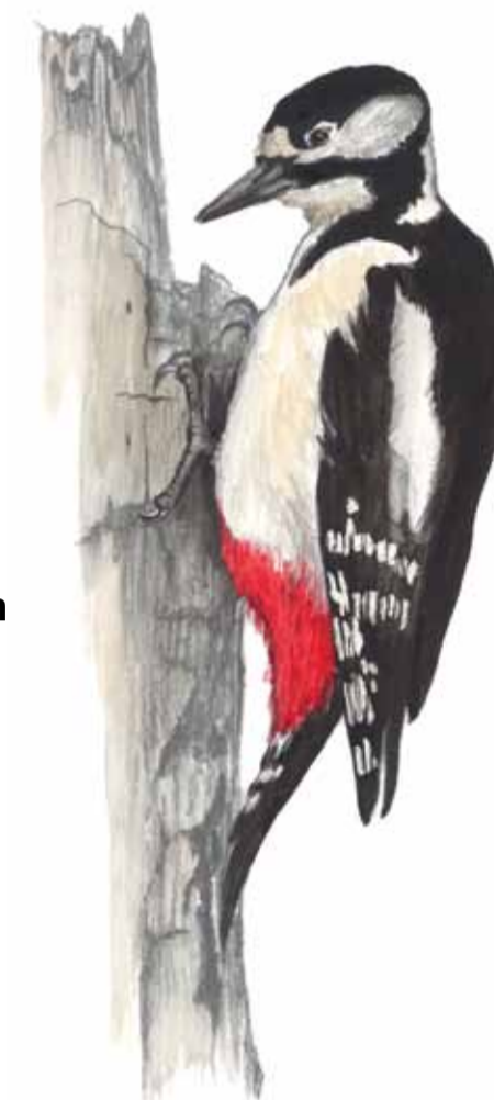
Större hackspett Dendrocopos major Greater spotted woodpecker