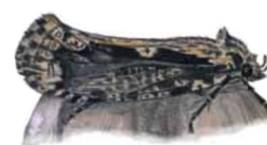
Jättesvampmal Scardia boletella Large fungus moth