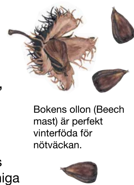
Bokens ollon (Beech mast) är perfekt vinterföda för nötväcken.

The woodland on the steep slopes has an old-growth character. The humidity is high and fungi, lichens and mosses thrive here. One example includes the rare moss bluish veilwort, which grows on the trunks of broadleaved trees, in dense, damp woodland. The beech woodlands in Näsums Bokskogar are allowed to develop freely – young trees need to get along with old and dead trees.