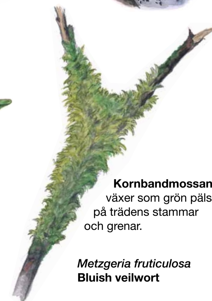
Kornbandmossan växer som grön päls på trädens stammar och grenar. Metzgeria fruticulosa Bluish veilwort