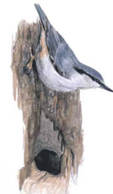
Den oblyga nötväcken bygger sitt bo i gamla hackspetthål. År hålet för stort muras det till rätt storlek med lera.