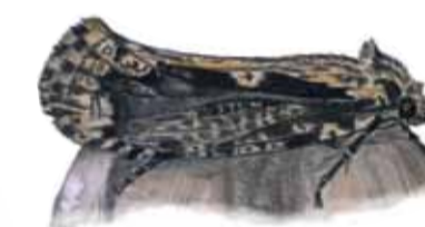
Jättesvampmal Scardia boletella Large fungus moth