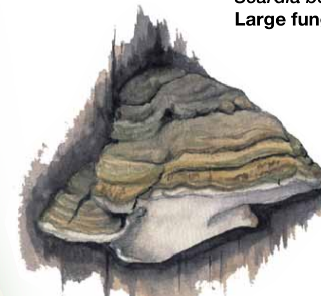
Fnösktickan erbjuder bostad åt larven till en stor malfjäril, jättesvampmalen. Fnöskticka Fomes fomentarius Tinder bracket fungus