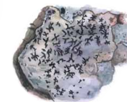
Stiftklotterlaven växer på gamla ädellövträd, oftast bok i Skåne. Opegrapha vermicellifera