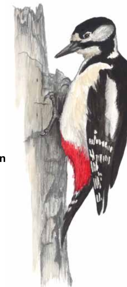
Större hackspett Dendrocopos major Greater spotted woodpecker