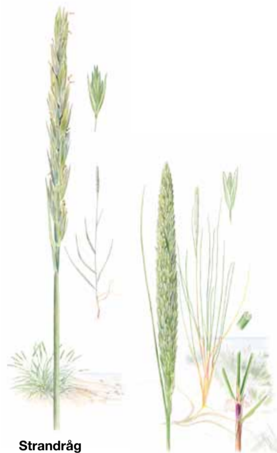
Strandråg Sea lyme grass Leymus arenarius Sandrör Marram Ammophila arenaria