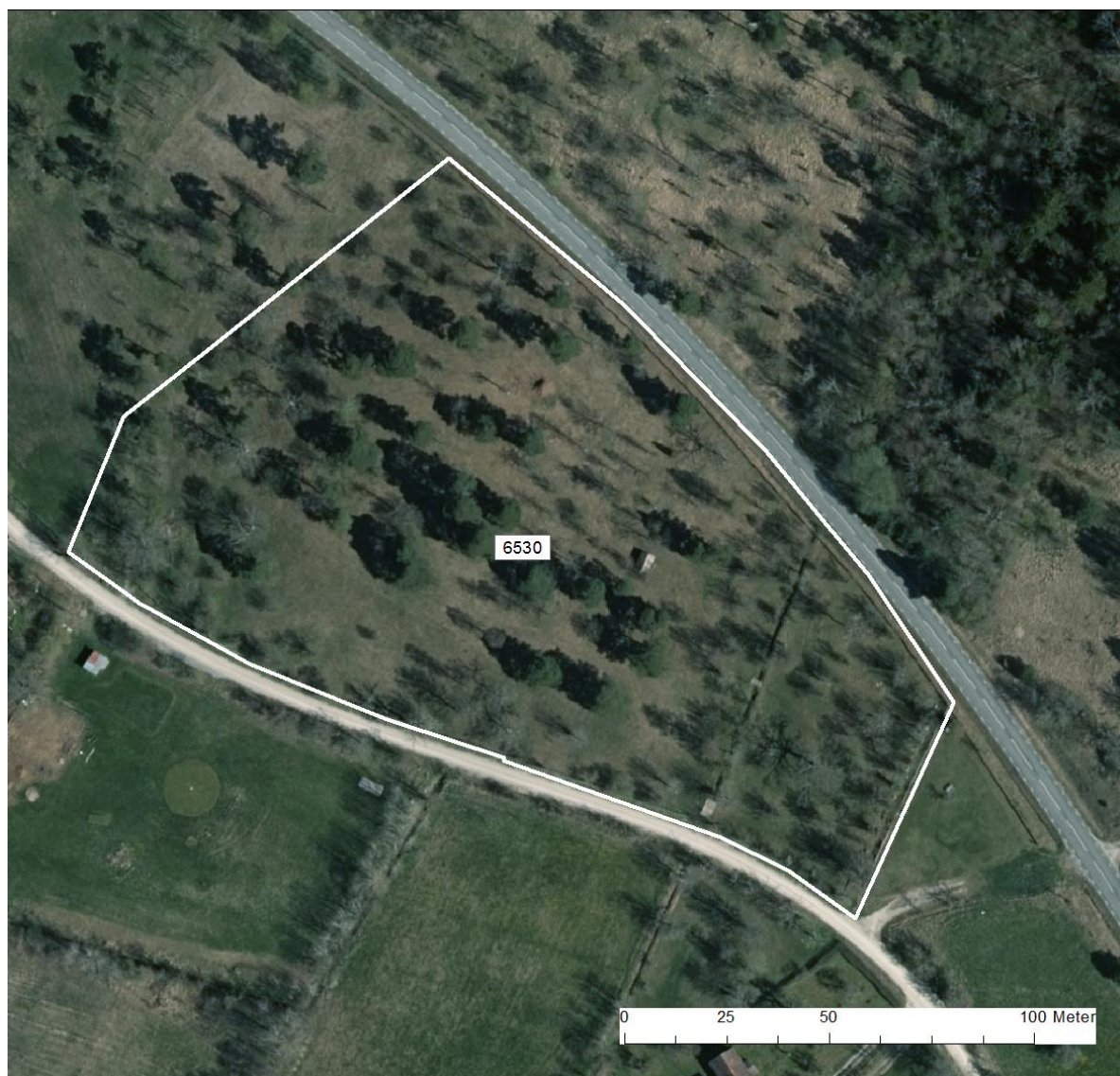
Natura 2000-området Anga prästänge med utbredning av naturtypen; Lövängar (6530).