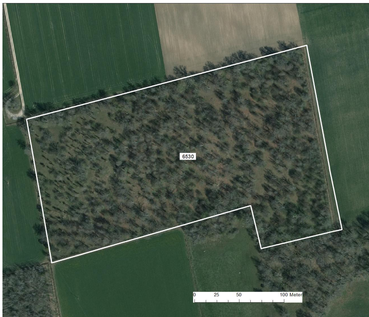
Natura 2000-området Alvena lindaräng med utbredning av naturtypen; Lövängar (6530).